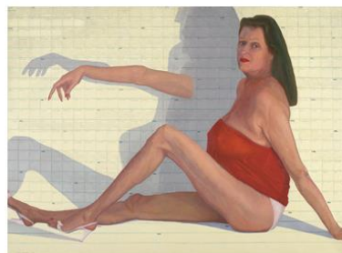
מימין: נערת לוח השנה , שמן על בד, 135X185, 2003; משמאל: נלי , שמן על בד, 130X180, 1997

בסידרת פיתוי מופיעות נשים מבוגרות בעירום חלקי. נערת לוח שנה מצוירת על רקע לוח השנה של חייה והזמן רשום כרונולוגית על הלוח, אבל גם על הגוף והרגליים. היא זורקת יד מנותקת מהגוף קדימה, בתנוחה המזכירה קצת את בריאת האדם של מיקלאנג'לו. נערה נוספת היא נלי , אישה מבוגרת יפיפייה, כמו בובה גדולה שנזרקה בסוף היום לפינה. הדיוקן שלי מציץ ומתבונן בה מהצד.