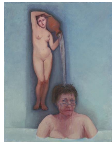
מימין: דיוקן עצמי עם ה"מעין" של דומיניק אנגר, שמן על בד, 60X90 ס"מ, 2015; משמאל: דיוקן עצמי עם "מיס יוני 1944", שמן על בד, 60X50 ס"מ, 2015