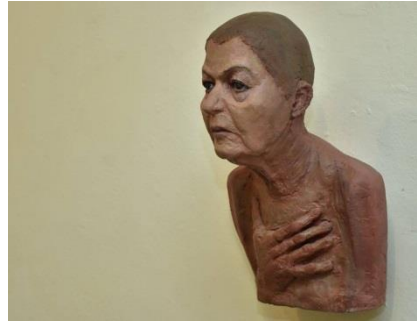
דיוקן עצמי אלומיניום צבוע, גובה 55 סמ 2014 .

מתחת לחגורה. כלומר הדמות צוירה במיוחד כדי לעורר מינית את הגבר. הציטוט כאן הוא מאיורים מפורסמים מאד של וורגה, שהופיעו בהרבה מאד לוחות שנה המיועדים לגברים - לוחות שנה שהיו חביבים על חיילים אמריקאים במלחמת העולם השנייה. האישה המופיעה כאן, הבלונדינית האולטמטיבית, הרוכבת על הראש שלי, היא הסבתא של כל נערות לוח השנה, שיפיעו מאוחר יותר, ומופיעות עד היום על שערי המגזינים לגבר. שום דבר לא השתנה.