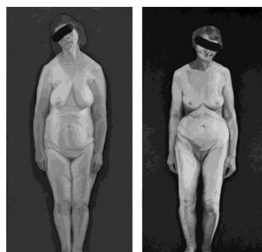
שחזור הדמויות מצונזרות, כפי שפורסמו בעתון וּסְטִי בעקבות התערוכה עדות

פרופ' גרגורי אוסטרובסקי מבקר האמנות של העתון בשפה הרוסית וּסְטִי , כתב ביקורת מאד אוהדת על התערוכה. וּסְטִי סרבו לפרסם את הביקורת, במקומה פרסמו כתבה לא כל כך אוהדת, בה כיסו חלק מעיני הנשים בפס שחור.