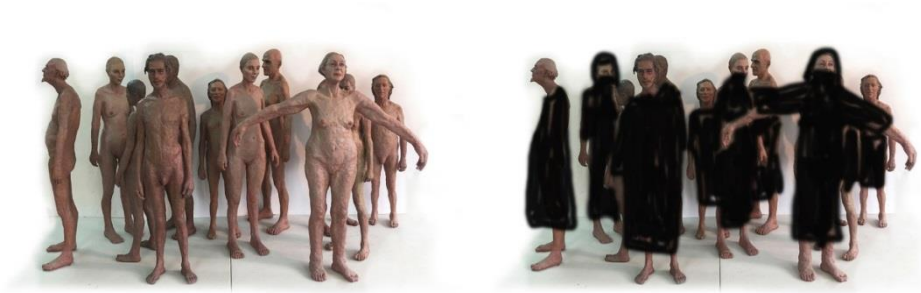
משמאל: קבוצת דמויות, פסלי אלומיניום צבועים גובה עד 80 ס"מ. דמות האישה בחזית מוצגת עכשיו בתערוכה ב"מאנה כץ"; מימין: גרסה מצונזרת לפייסבוק. למטה: בעקבות צנזורה של מירי רגב על העירום, הצעה צנועה יותר.