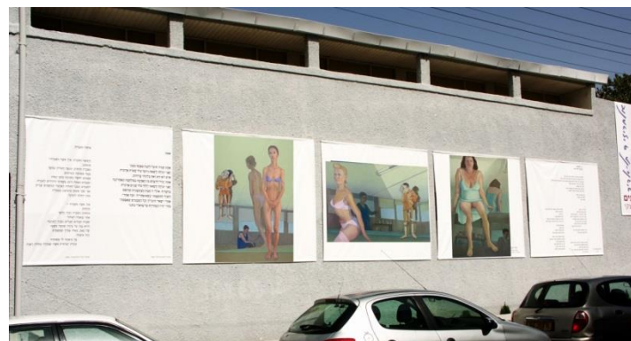
נערות לוח שנה ושירי שרמוטה קיר בית האמנים בתל אביב, הדפס דיגיטאלי 2000X400 ס"מ 2005