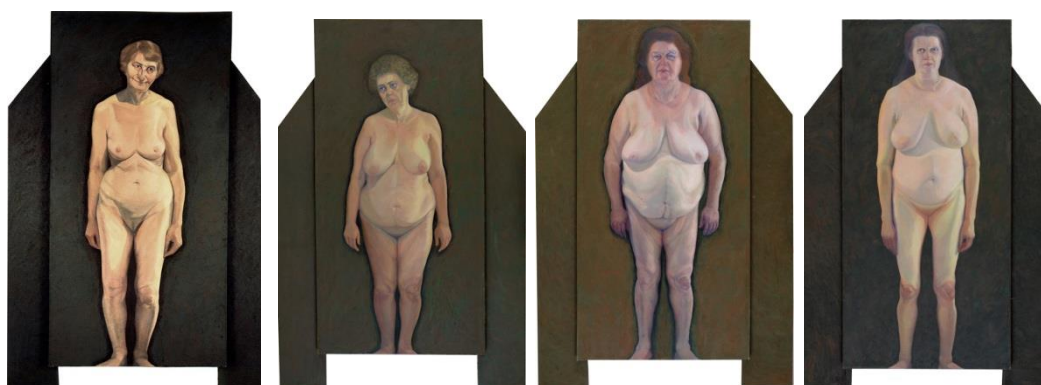
עדות , שמן על בד ודיקט 220X152 ס"מ כל אחד. 1992-1994