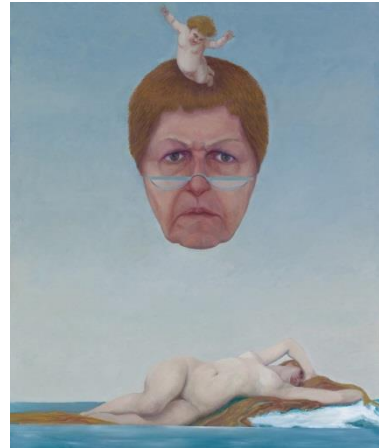
דיוקן עצמי עם "הולדת ונוס", שמן על בד, 100X120 ס"מ, 2017

בהמשך יצרתי סדרה של שלוש עבודות בהן אני מתבוננת בונוס, מודל היופי של האישה המושלמת. ונוס מקורה מהמילה הלטינית Venia שפרושה חסד אלוהי. בדיוקן עצמי עם "הולדת ונוס" , אני מכניסה את הדיוקן שלי לתוך התמונה הקנונית של אלכסנדר קבנל, הולדת ונוס . ונוס שנולדה מגלי הים. קבנל, שהיה צייר אדיר, צייר יופי מושלם של אישה אלוהית, רוחנית מאד. אישה שהיא לא בשר ודם, אלא אידאל נשי חף מפגמים והיא לא רק יפה אלא כנראה גם טובת לב כמו קודמתה היוונית אפרודיטה, שהעניקה אהבה חסרת גבולות. והענישה את המזלזלים באהבתם של אחרים. ואני שואלת את עצמי, מה אני עושה עם כל הטוב הזה? טכנית, לא היה פשוט להתמודד עם הציור של קבנל. הציור הוא לא ציור ראליסטי, כמעט מטפיזי, הוא צייר מאד אנליטי, שמחפה על הרישום האנליטי גאומטרי של הדמות עם כתמים בעלי שוליים מאד רכים. וזה לא פשוט להעתיק אותו, מבלי לאבד את המימד הרוחני של הדמות.