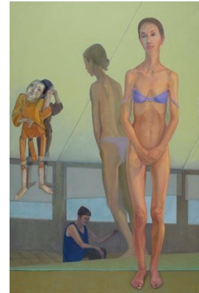
ימין: הפיתוי, שמן על בד, 135X185 ס"מ 2001-2002; שמאל: הפיתוי שמן על בד, 150X100 ס"מ-2002 2001