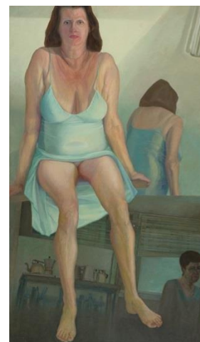
אווה , שמן על בד, 105X199 ס"מ, 1999.

אווה היא סצנה שמתרחשת לפני מראה. יש מראה מאחורי הדמות המרכזית ובה משתקפת הדמות שלי בסטודיו. הדמות בקדמת הבמה היא צבעונית וזוהרת, והדמות שלי מאחור אפורה ומשעממת, כמו פועלת שחורה של אמנות. אני כאילו מציצה באשה היפה שעדיין נאחזת בשרידי יופיה. אשה זרה שהגיעה משם, מארופה, ונשארה כאן, נטע זר, כמו שחקנית קולנוע של פעם.