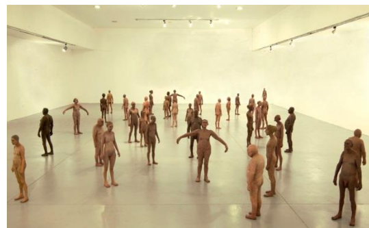
כיכר העיר מיצב בבית האמנים בתל אביב, פסלי אלומיניום צבועים, 2011

העבודות קיבלו הרבה מאד תקשורת ושרדו על הקיר במשך שלושה חדשים.