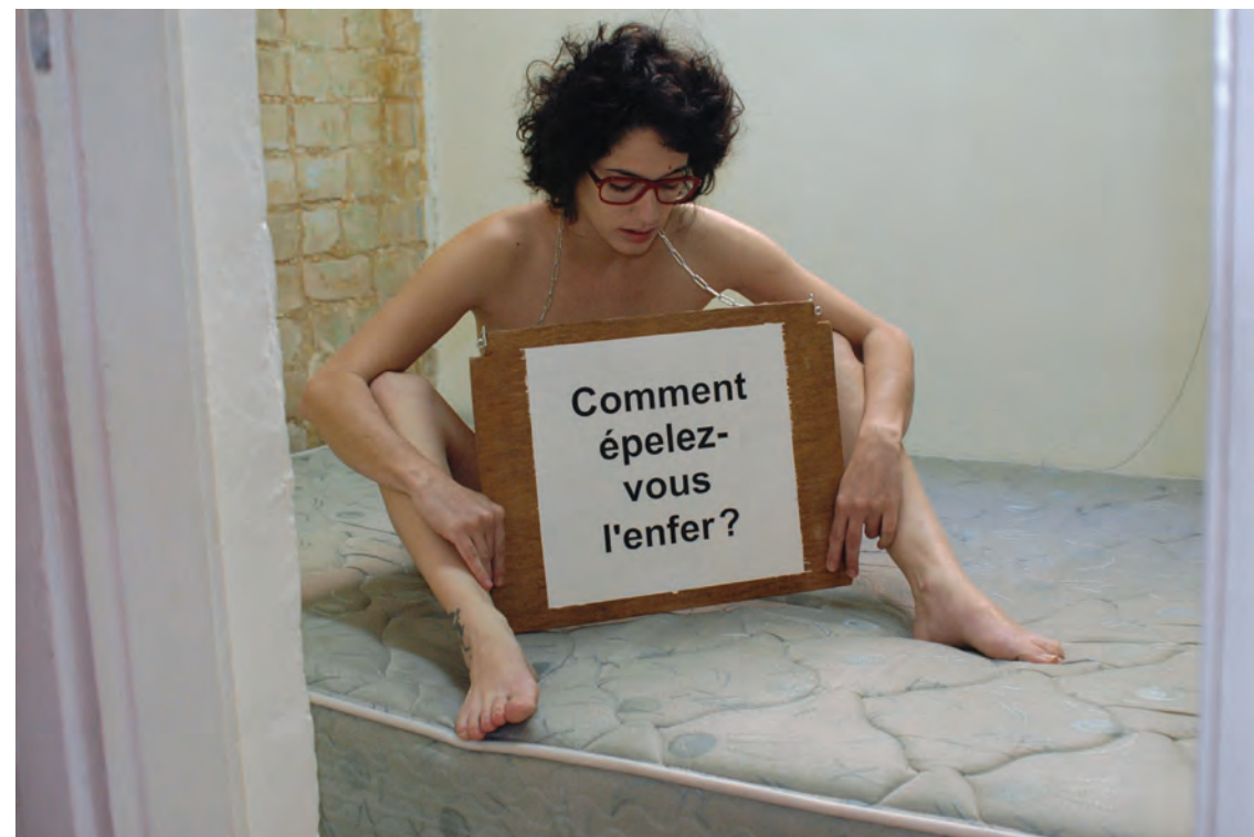
יעל יודקוביק , Comment épelez-vous l'enfer? (איך מאייתים גיהנום?), צילום צבע, 2010. Yael Yudkovik, Comment épelez-vous l'enfer?, (How do you spell hell?), C-print, 2010.