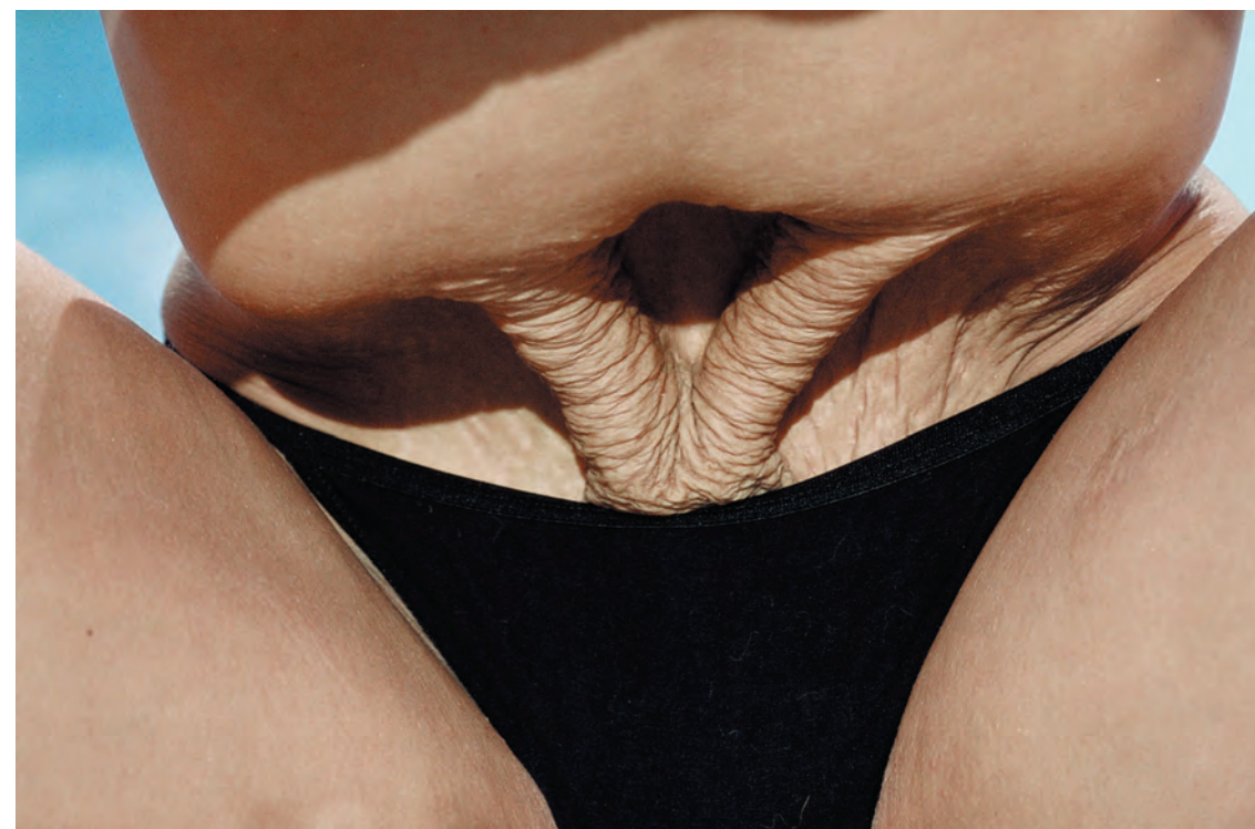
שירה ריכטר , צילום צבע, האם, הבת ורוח הקודש, 2002. Shira Richter, The Mother, Daughter and Holy Spirit, Color photograph, 2002.