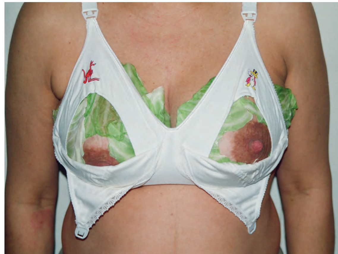
דליה זרחיה , "מצבי צבירה", צילום צבע, 2000. Dalia Zerachia, Accumulative, Color photograph, 2000.