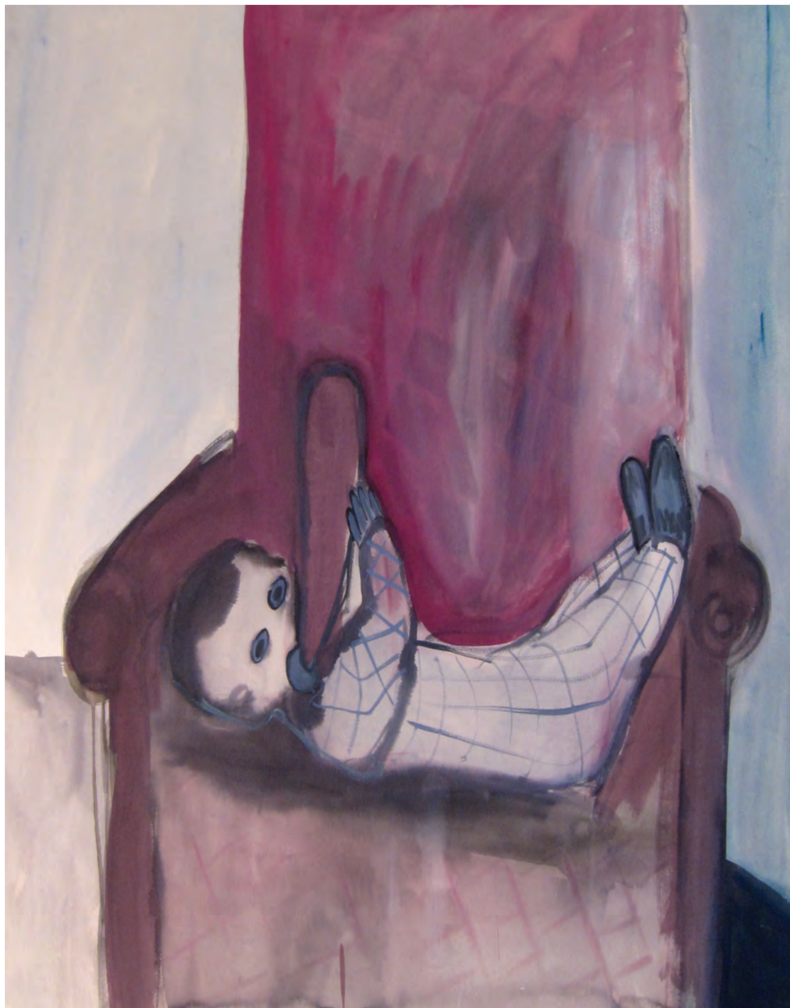
טלי בן בסט , ללא כותרת, צבע גואש על נייר, 2009. Tal Ben Bassat, Untitled, Gouache paint on paper, 2009.