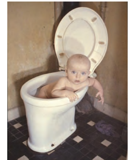
זופיה קוליק (אמני Kwiek), מתוך "פעילויות עם דוברומירז", 1972-1974

האמנית ברברה קרוגר מעלה את השאלה, האם יש אצל האם אהבה אוטומטית לתינוק. בתצלום שלה נראה תינוק עירום לחוץ בין ברכי אישה, ועל גבו שלט: "אהבה חופשית". קרוגר תוקפת את הרעיון של אהבת אם מיידית וללא תנאי, ובכך נוגעת בעקיפין בנושא (מחקרים פסיכולוגיים ואנתרופולוגיים וכתבים של פמיניסטיות בולטות העלו ספקות בדבר טבעיותם של הרגשות האימהיים וזרעו אור על חלקה של הלמידה החברתית בפיתוח רגשות אלה). 8 העבודות של קרוגר עוסקות בשיח הפסיכואנליטי ובעיצוב החברתי על האימהות. הן מציגות את קולה של האם שדוכא עד כה, ומאפשרות מבט מעמדתה ועימות מול הכעסים שמעורר לעתים הסטטוס החדש שלה.