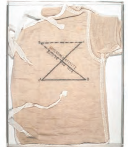
פרט "מסמך פוסט לידתי", מיצב בשישה חלקים, מארי קלי 1973-1979

בשנות השבעים של המאה התחילו אמניות מובילות להציג התייחסות לאימהות ולקשר בין האם לתינוק מורכבת מזו שהייתה בעבר. האמנית מארי קלי, בעבודתה "מסמך פוסט-לידה" (Post-partum Document, 1973-1979), יצאה נגד הניגוד המסורתי שהיה עד אותה עת בין אימהות ליצירתיות, ועסקה בעולם הרגשי של האם אחרי לידה ובמהלך שנותיו הראשונות של הילד. קלי עיבדה ממצאים, פריטים ומידע המתאייסם לקשר שלה עם בנה, ואם כי העבודה אינה עוסקת מפורשות בדיכאון אחרי לידה, היא נוגעת בתהליך המתמשך שבין האם לתינוק, תהליך הכרוך ברגשות מגוונים, קשיים, חרדות וחי יום-יום משמימים. קלי הציגה רגשות מורכבים ומנוגדים הכרוכים באימהות, שבאותה תקופה כמעט שהיו בבחינת טאבו. היא לא חששה לעסוק בנושא, שפגע לכאורה במעמדה כפמיניסטית, והצליחה להתעמת עם הרגשות השליליים והחיוביים שחשמו את האמניות הפמיניסטיות בנות דורה מלבחון דברים מעמדתה של האם. בראיונות שהעניקה העידה קלי על הקרע שחווהה כאם הנדרשת למלא פונקציות רבות בעת ובעונה אחת - להיות גם אם וגם אמנית, גם אישה פרטית ואשת איש בבית פנימה וגם אישה בעלת שאיפות פוליטיות המעוניינת להישמע כפמיניסטית בספירה הציבורית. ביצירה זו חותרת קלי באופן קיצוני תחת אוסף הדעות הקדומות הנוגעות ל"אימהות הטבעית" ול"אינטימקט האימהי". 7