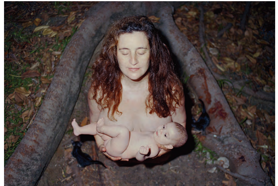
פסי גירש "טינה וליאן", צילום צבע, הזרקת דיו על נייר, 2005. Pesi Girsch, Tina and Lian, Inkjet on fine Art paper, 2005.