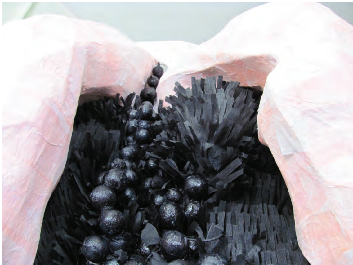
מיטל כץ-מינרבו , פרט מתוך היסוד החומרי/גופני, טכניקה מעורבת, 2011. Meital Katz Minerbo, Part from the material bodily element, Mixed media, 2011.