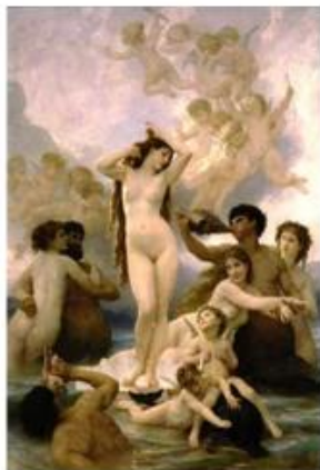
וויליאם אדולף בוגאר, הולדת שמן על בד, מוזיאון ד'אורסי, פריז

בתנוחות המזוהות כנוסחאות יופי מסורתיות. כך חיקו בהגזמה תנועות סטריאוטיפיות מתוך האיקונוגרפיה של ונוס בציורי עירום (תמונה 17).