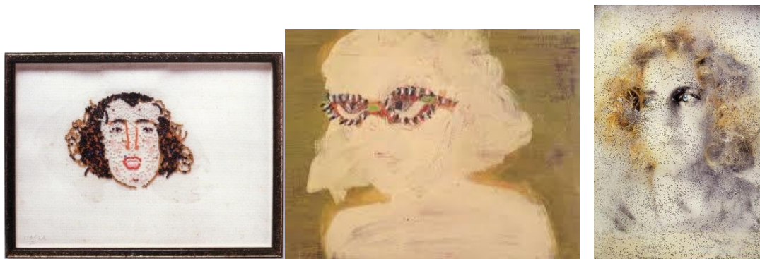
תמונה 3 , מאירה שמש, דיוקן עצמי בלונדיני , 1993, תצלום, שיער פלסטיק, נוצצים ו"אבנים" כחולות, 22X18 ס"מ; תמונה 4 , מאירה שמש, דיוקן עצמי , 1991, שמן על בד, 55X75 ס"מ; תמונה 5 , מאירה שמש, דיוקן עצמי בחרוזים , 1992, חרוזים רקומים על בד לבן, ממוסגר, 25X37 ס"מ.

הדמות בתצלום מהורהרות, דבר שמקנה לדיוקן אופי של דמות נכספת, חלומית. על התצלום מפוזרות סוכריות בצבע כסף הנדמות לחירורי תולעים. דיוקן זה מתפרש כתשוקה לנכס יופי וזוהר, אך גם חותר תחתיה. לעומת זאת, בדיוקן העצמי הבא (תמונה 4) תווי-הפנים מחוקים, פרט לעיניים מאחורי זוג משקפיים צבעוניים. הדגשת חוש הראייה - העיניים כראי הנפש - רומזת לעליונותו בחייה ככלי לקליטה ולהתבוננות בעולם. עיניים הם מוטיב חוזר בעבודותיה ואפשר שמעיד על פיקחון ומודעות לעומת הדמויות המצוירות ללא עיניים, שנראה בהמשך. בדיוקן עצמי בחרוזים (תמונה 5) הפנים הרקומות בחרוזים, מתקבלות כעור פגום, אולי כסימון של "אחרות" ואולי כהתרסה נגד אידיאל היופי הנשי המכתיב עור חלק. 4