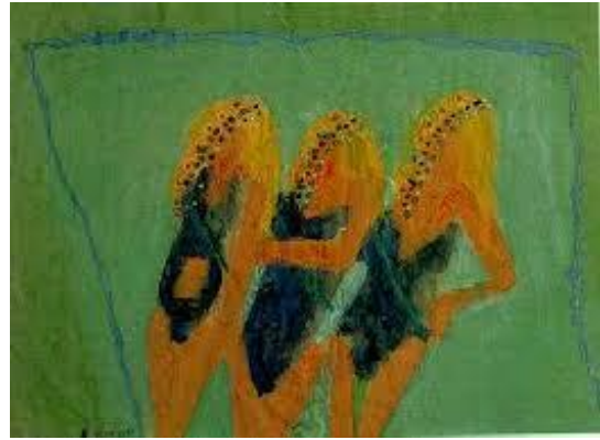
תמונה 6 , מאירה שמש, סדרת מלכת היופי , 1989, צבע מים על נייר; תמונה 7 , מאירה שמש, 1989, סדרת מלכת היופי , צבע מים על נייר.

בדימוי אחר מאותה סדרה מצוירות ארבע מועמדות בבגדי-ים ( תמונה 7 ). תיאור שערן המופרז ורגליהן הדקיקות משרטט דימוי קריקטורי. התבוננות מקרוב חושפת רישול ועילגות מכוונים. ( תמונה 8 ) המחרוזות המנוקדות מתחברות ונדמות לגירלנדות ( תמונה 9 ) וכך נטענות באירוניה.