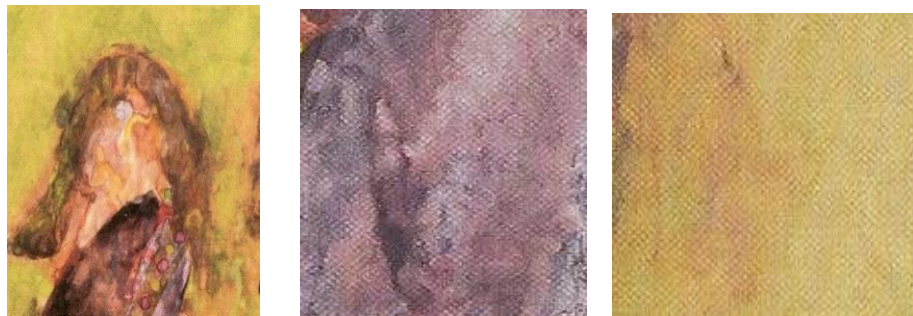
תמונות 14 15, מאירה שמש, 1989, סדרת מלכת היופי, הגדלת פרטים, צבע מים על נייר

לעטוף ולהגן על הדימויים. הציור בצבעי מים יוצר שלוליות עכורות של צבעים שהתערבבו, יצאו משליטה וניקוו ככתמים, זלגו מדימוי לדימוי וגרמו לנייר שיתכווץ ויתקמט. עולה תחושה שהנייר אינו יכול לספוג את מי הצבע (כמו שקורה בטכניקת האקוורל), ובהשאלה ניתן לומר שהמצע אינו יכול להכיל את הדימויים. במקומות בהם שולט הצבע הסגלגל והירקרק הוא משווה לדימויים מראה של עור חבול, חולה וכאוב (תמונה 14, 2 פרטים). טפטופי הצבע על פני הנשים נראים כדמעות שקלקלו את האיפור (תמונה 15). בסדרה זו דימויי היופי הנשי מוצגים במלוא פגיעותם ובמלוא פוטנציאל ההתכלות שלהם.