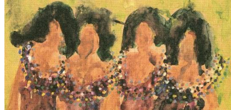
תמונה 8 , מאירה שמש, 1989, סדרת מלכת היופי , פרט, צבע מים על נייר; תמונה 9 , סרקופג רומי, פרט, המאה ה-3 לספ', אבן, ללא פרטים נוספים.

בדימוי נוסף ( תמונה 10 ) שלוש המועמדות הלבושות בשמלות נראות צועדות בסך. גם פניהן המוסבות לחזית נעדרות תווים.