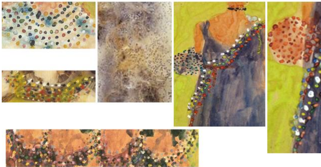
תמונה 21, מאירה שמש, פרטים מתוך מבחר ציורים.

לסיכום, דימויי היופי של מאירה שמש היו מקוריים וחלוציים באמנות ישראלית. העילגות המכוונת, מבטאת לדעתי התנגדות לגימור מושלם והיא מתפרשת כדיבור בשפת המוחלשות, שאינן רוצות לדבר ב"שפת האדון". מצאתי בעבודות רבות, גם באלה שאינן עוסקות ביופי נשי נטייה לשימוש באובייקטים קטנים, מתכלים ומתפזרים כמו: סוכריות וחרוזים, וכן נטייה לצייר דימויים שמייצגים יופי ונשיות כמו מחרוזות, פרחים, סרטים וקישוטים (תמונה 21)