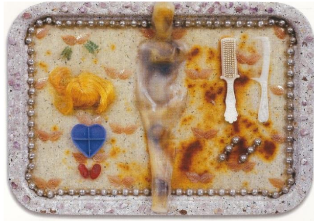
תמונה 19, מאירה שמש, 1992 בקירוב, חלקי בובות, מסרק, מברשת פלסטיק, חרוזים ומחרוזת מודבקים על מגש, 28.5X40.5 ס"מ

בעבודה אחרת (תמונה 18) המצע לדימוי הברבי הוא מגש פלסטיק זול מקושט במסגרת של חרוזים מוכספים ובתוכו מודבקת במרכז בובה שאיבדה את צלמה. היא שקופה ויש עליה כתמים סגולים שמתקבלים כסימנים כחולים של חבלות. סביב הבובה מודבקים אביזרים מתוך ערכת ברבי סטנדרטית. ברקע מרחפים עלי פלסטיק שהודבקו בצמידות והם מתקבלים ככנפיים – כחלום, בעוד הכתמים הצהובים על גבי המגש נראים כסימני חלודה וריקבון. הבחירה להציג את הבובה ופריטי בובת הברבי על גבי מגש משווה לעבודה אופי של הגשה או הקרבה. מושג היופי הנשי העשוי ממקבץ של אביזרים שהתרבות הפופולרית הבנתה כמכונני יופי נשי מתקבל כחפץ – כרדי-מייד, שבו דרים בכפיפה אחת גם כיסופים ליופי וגם הכרה בהבלות. העבודות הקטנות הללו, עשויות מחומרים זולים, היו ניגוד מוחלט לפיסול הישראלי גדול הממדים, אשר רווח בשנות ה-90 של המאה הקודמת.