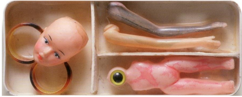
תמונה 18, מאירה שמש, חלקי בובות פלסטיק, קלמר, 1991, טכניקה מעורבת, 7.5X18 ס"מ.

בעבודה אחרת (תמונה 18) המצע לדימוי הברבי הוא מגש פלסטיק זול מקושט במסגרת של חרוזים מוכספים ובתוכו מודבקת במרכז בובה שאיבדה את צלמה. היא שקופה ויש עליה כתמים סגולים שמתקבלים כסימנים כחולים של חבלות. סביב הבובה מודבקים אביזרים מתוך ערכת ברבי סטנדרטית. ברקע מרחפים עלי פלסטיק שהודבקו בצמידות והם מתקבלים ככנפיים – כחלום, בעוד הכתמים הצהובים על גבי המגש נראים כסימני חלודה וריקבון. הבחירה להציג את הבובה ופריטי בובת הברבי על גבי מגש משווה לעבודה אופי של הגשה או הקרבה. מושג היופי הנשי העשוי ממקבץ של אביזרים שהתרבות הפופולרית הבנתה כמכונני יופי נשי מתקבל כחפץ – כרדי-מייד, שבו דרים בכפיפה אחת גם כיסופים ליופי וגם הכרה בהבלות. העבודות הקטנות הללו, עשויות מחומרים זולים, היו ניגוד מוחלט לפיסול הישראלי גדול הממדים, אשר רווח בשנות ה-90 של המאה הקודמת.