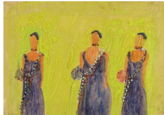
תמונה 12 , מאירה שמש, 1989, סדרת מלכת היופי , צבע מים על נייר, ללא ציון מידות; תמונה 13 , מאירה שמש, 1995, שמן על בד, 120X160, ס"מ, אוסף פרטי.

בציורים בהם המועמדות מוצגות בקרבה זו לזו מתחזקת תחושת השכפול. הדבר בולט במיוחד בציור שמן מאוחר יותר (תמונה 13) מ-1995, שבו מתוארות חמש מועמדות בתחרות יופי לבושות בשמלות אדומות ארוכות שמסתירות את נעליהן. הרקע השחור מתחת לרגליהן מקנה להן תחושת ריחוף. העמדתן צמודות בשורה מתקבלת כמו תוצאה של מגזרת-נייר שקופלה וגרמה לשכפול הדמות. פני המועמדות נראות כמסכות ללא תווי פנים. הרצפה בציור נראית עקומה וברקע מאחוריהן נזילות צבע עכורות ומתריסות.