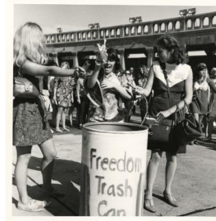
תמונה 16, תצלום מההפגנה באטלנטיק סיטי, 1968.

עשרים שנה קודם לכן, בארה"ב, זכה דימוי מלכת היופי להתייחסות ביקורתית באמנות הפמיניסטית, ולגינויים שהתבטאו בהפגנות פוליטיות. אחת ההפגנות המפורסמות התקיימה בספטמבר 1968 באטלנטיק-סיטי, שם נערך הטקס השנתי להכתרת "מיס אמריקה". מחוץ לאולם התארגנה הפגנה שיזמה הקבוצה הפמיניסטית הניו-יורקית, שנודעה בשם "הנשים הרדיקליות של ניו-יורק" (NYRW – New-York Radical Women). 11 כמאתיים פמיניסטיות שבאו מרחבי החוף המזרחי הפגינו במחאה נגד המשך הדיכוי של היופי הנשי. השלטים שנשאו כללו כתובות כמו: "לא עוד מיס אמריקה" "נשים הן בני אדם, לא חיות", "האם מייק-אפ יכול להסתיר את פצעי הדיכוי?" המפגינות התלוננו על כי נשים בחברה המערבית נאלצות להתחרות על בסיס יומיומי כדי לקבל את אישורם של גברים לגבי סטנדרטים מגוחכים של יופי. הן ערערו על התפקיד הפוליטי המוטל על מלכת היופי, כדוגמת המלכה שנשלחה שנה קודם לוווייטנאם לעודד את הלוחמים למען "ימותו ברוח טובה". כמו כן מחו על כי מאז החלו תחרויות היופי בארה"ב ב-1921 לא התמודדה על התואר אף אישה לא-לבנה. המארגנות הזמינו את הנשים להביא חפצים המזוהים כנשיים, על מנת לבצע טקס גירוש מהם. בשיאו של האירוע הציבו המפגינות פח אשפה עליו התנוססה הכותרת "פח האשפה של החירות", לתוכו השליכו הנשים את כל מה שסימל בעיניהן את הדיכוי הנשי ואת העריצות הגברית: נעלי עקב, ריסים מלאכותיים, גיליונות "פלייבוי", גלגלי שיער, מחוכים וחזיות (תמונה 16). שם נולד המיתוס הידוע בדבר שריפת חזיות על יד פמיניסטיות. 12