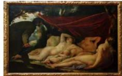
ז'אק בלאנשאר, ונוס ושלוש הגרציות מופתעות על ידי בן התמונה, 1831-1833, שמן על בד, מוזיאון הלובר, פריז