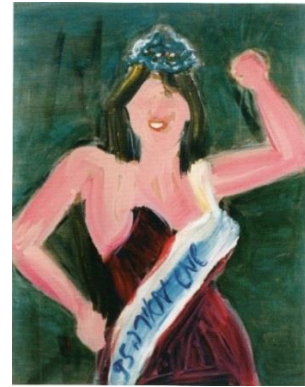
תמונה 2, מאירה שמש, שמש מאירה 95, 1995, שמן על בד, 130X100 ס"מ.

שמש מאירה 95 (תמונה 2) ואשר צויר שנה לפני מותה מתוארת סצנה מדומיינת של רגע הכתרתה, כביכול, למלכת יופי. לפנינו תיאור חלקו העליון של גוף אישה חטוב, לבושה בשמלה חשופת כתפיים בצבע אדום-בורדו ועל ראשה מעין כובע או כתר מעוך. באלכסון לגופה מוצמד סרט כחול-לבן ועליו הכיתוב "שמש מאירה 95". כך נהגה לחתום בציוריה, דבר שמתקבל בדוק של אירוניה עצמית כ"שמש מאירה" (במלרע). משמעותו המשתנה של שמה בהתאם להטעמה מעלה לתודעה את עניין ההגייה בשפה העברית המתחלקת לספרדית ולאשכנזית: מלעיל ומלרע. אפשר שמובלעת בו רמיזה לשורשים של הוריה שעלו מעירק ולמידת היטמעותם בתרבות הישראלית. סרט ההכתרה הכחול-לבן ממקם את הדימוי כישראלי. מיקום החתימה על גבי הסרט, ולא כמקובל בפינת הציור, מזכיר את חתימתו של ואן גוך על גבי הכד בסדרת ציורי החמניות (1887), שנקראים גם "פרחי שמש", ואשר הפכו למייצגים את יצירתו. כך נטענה חתימתה - זהותה, בהקשר של "האמן הסובל".