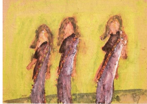
תמונה 10 , מאירה שמש, 1989, סדרת מלכת היופי , צבע מים על נייר, 34.5X49 ס"מ; תמונה 11 , מאירה שמש, 1989, סדרת מלכת היופי , צבע מים על נייר, 35X49.5 ס"מ