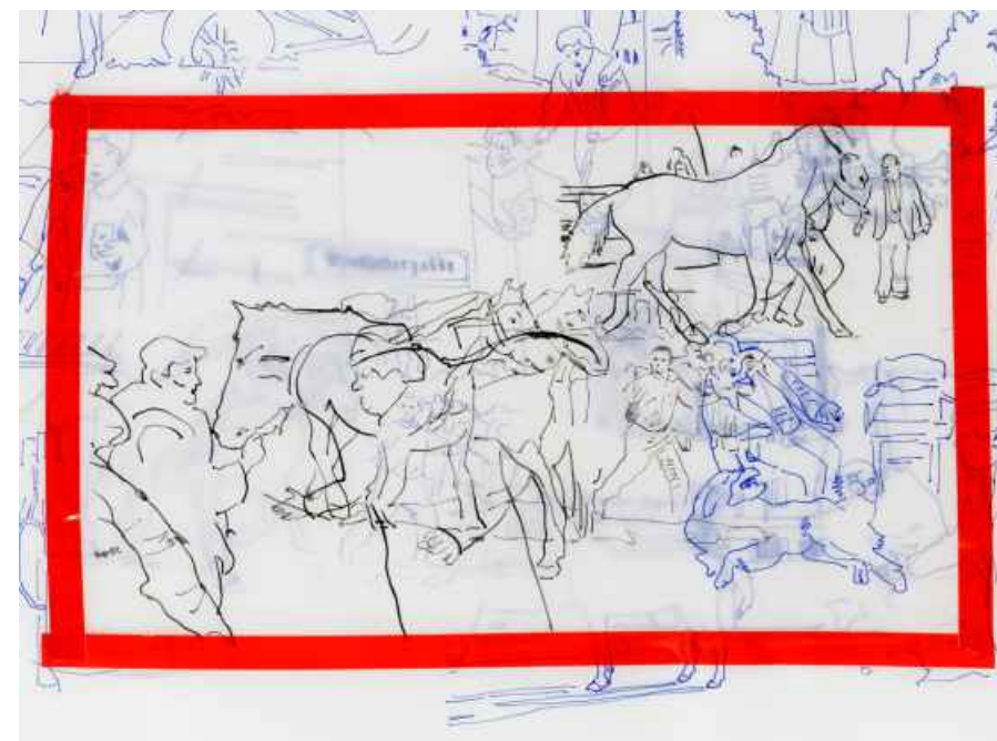
בל שפיר | Subortus 2015, אנימציה, 6 דקות

ציורה של טנהאוזר היא עבודה נועזת ואמיצה של דיוקן עצמי כפול. היא מתארת רגעים אינטימיים ובסיסים, המגלמים היבטים פרוידיאניים. האמנית מתעדת את עצמה ישובה על הכס, מושב האסלה, שבסטודיו שלה. היא מישרת מבט אל הצופה, מבוששת, מהורהרת ויחד עם זאת נחושה. ידיה לפני גופה, היא לבושה שמלת קיץ קלילה עם דגמי לבבות. היא אינה לובשת חזייה, בלי מסכה על פניה, רק מעלה סומק קל בלחייה. אור המנורה התלווה מעל מכון כלפי הצופה. היא נמצאת ב'חדר משלה', קודש הקודשים, פשוט נמצאת, לומדת את עצמה, ממלאת את החלל הפרטי. החדר מקבל בכך מימד נוסף, מעבר לזה של האמנית המאכלסת את הסטודיו הפרטי. מצד שמאל, דמותה הכפילה של האמנית, אינה מהווה השתקפות מדויקת של הדיוקן המרכזי. הגוון הכחלחל של המראָה יוצר תחושה חלומית, לא ממשית. טנהאוזר מציינת כי השימוש בגוון המסויים הוא כחלק מדיאלוג שהיא מקיימת עם ציורי התקופה הכחולה של פיקאסו או העירומים הכחולים של מאטיס. היא תופשת את עצמה כמודל עירום חושנית ורגועה המהרהרת בשעת המימוזה.