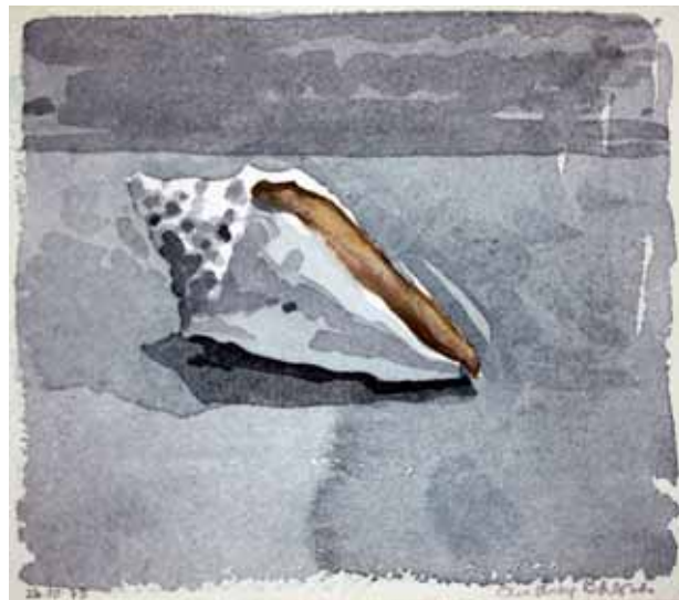
אודרי ברגנר, קונכיה, 1973, צבעי מים על נייר, 16X13 ס"מ קונכיה, 1975, צבעי מים על נייר, 16X13 ס"מ