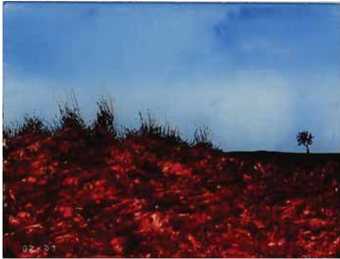
בן קדישמן , עץ, 2003 טכניקה מעורבת על זכוכית, 15X20 ס"מ