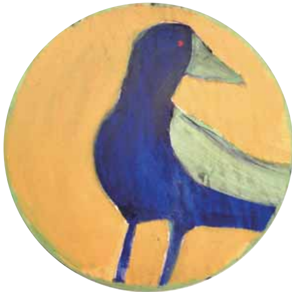
דורית קדר , עורב Crow מתוך הסדרה האינדיאנית, 2003, אקריליק ושמן על עץ, קוטר 60 ס"מ אווז Goose מתוך הסדרה האינדיאנית, 2003, אקריליק ושמן על עץ, קוטר 60 ס"מ