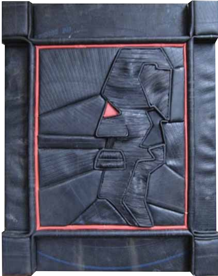
נִיר אוֹחִינ, עֵין אֲדוּמָה, 2009 רִיפּוּד, פְּנִימִית וְעֶץ, 70x50 ס"מ