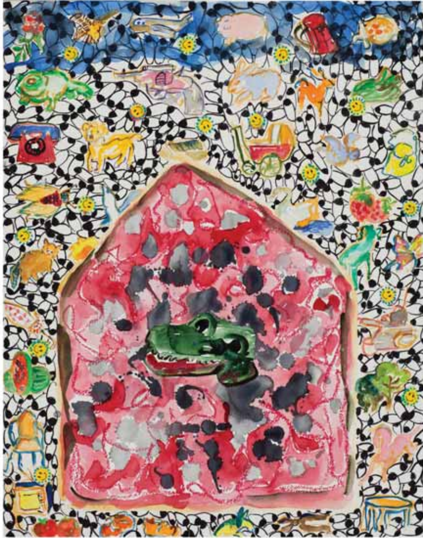
דינה הופמן, חייכנים עמוק בבטן, 2010, צבעי מים, אקריליק גירי שמן, עטים ומדבקות על נייר, 50x40 ס"מ