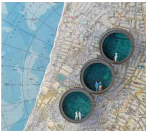
אבי יאיר, מחווה לשלושה עיגולים, 2009 טכניקה מעורבת, 30X31X3.6 ס"מ