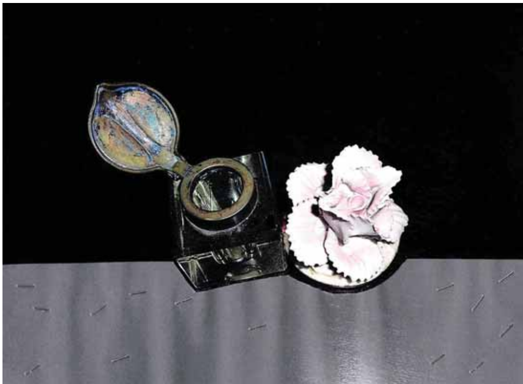
צילה פרידמן, ללא כותרת, 2014 צילום מטופל, 19X25 ס"מ