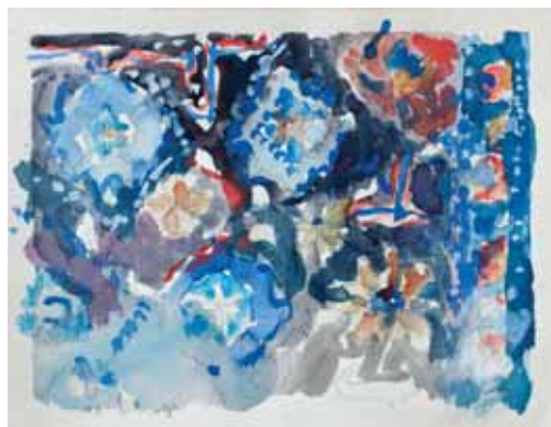
חגית שחל, אורגנונט, 1992 צבעי מים על נייר, 32X41 ס"מ (כ"א)