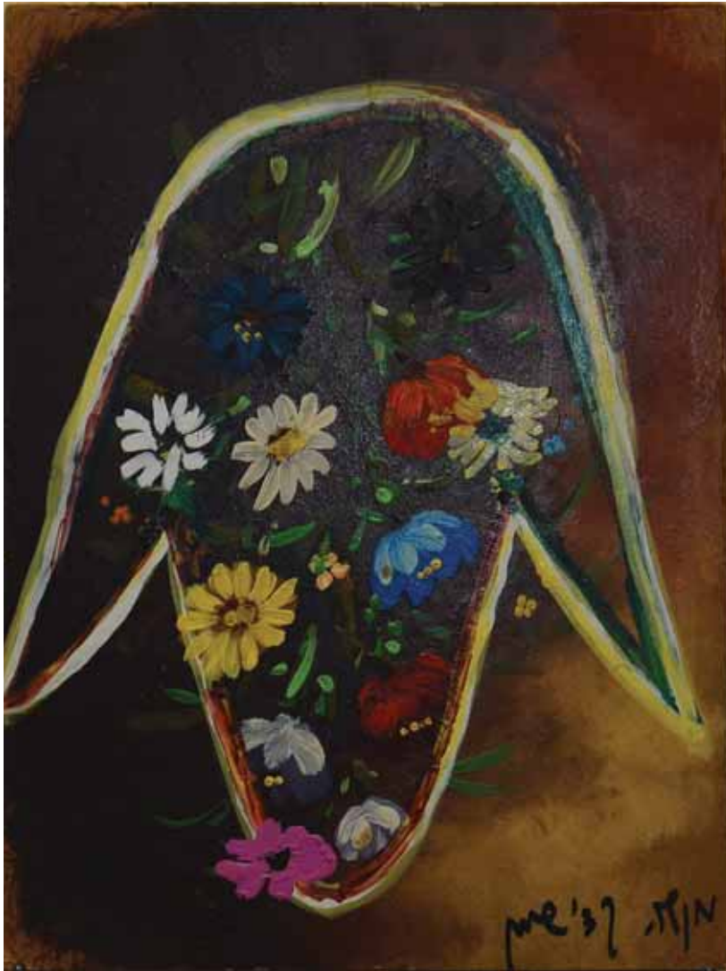
מנשה קדישמן, פרחים, 1991 שמן על מזוויט, 24X18 ס"מ