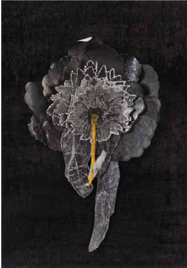
נגה יודקוביק עיצוני, פרח, מתוך סדרת פרחים, 2014 טכניקה מעורבת על נייר, 42X30 ס"מ