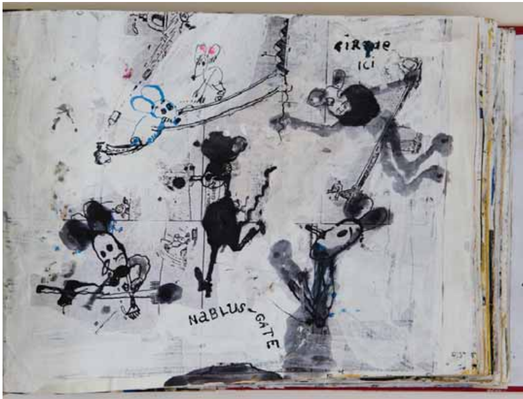
צבי טולקובסקי, מיקי מאוס בשער שכם, 2009 רישום ציפורן וקולאז' על נייר, 22x30 ס"מ