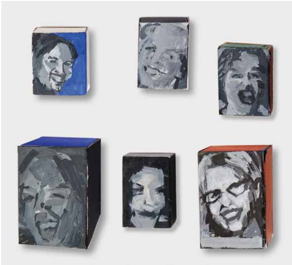
אורנה מילוא, סדרה של ציורי פורטרטים, 2014 גואש על קופסאות גפרורים, 5.2X3.5 ס"מ