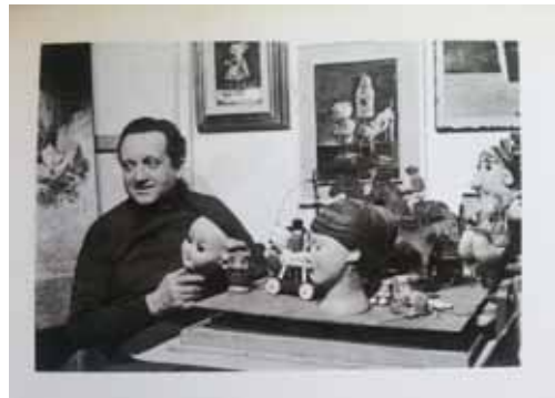
יוסל ברגר, צעצועים, רישומים מתוך מחברת סקיצות יוסל בסטודיו מתוך קטלוג ציורי צעצועים 1977, גלריה בינט