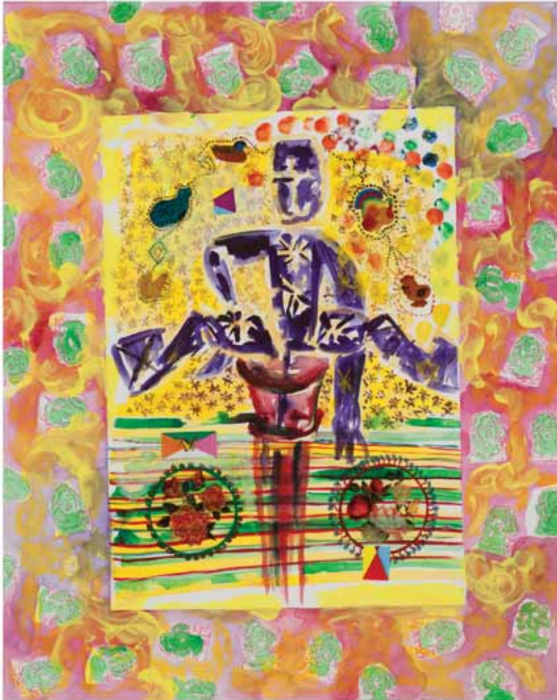
דינה הופמן, חייכנים עמוק בבטן, 2010, צבעי מים, אקריליק גירי שמן, עטים ומדבקות על נייר, 50X40 ס"מ