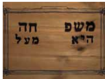
אילון ערמון, מגלומניה, 2008, אובייקטים