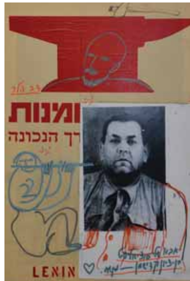
דב הלה , סוציאליסט, 2013 טכניקה מעורבת על הדפס רשת, 70X50 ס"מ סדנת ההדפס בירושלים