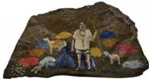
איציק למבז, הרועה, 1998 שמן ואקריליק על סלע, 16X31X3.5 ס"מ