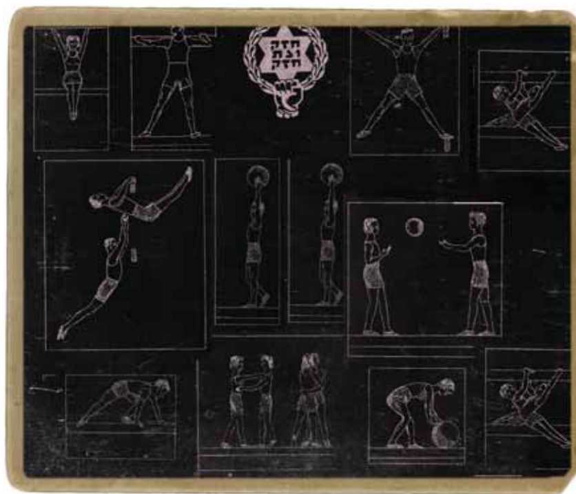
איריס גולדברג, ללא כותרת, 2014, טכניקה מעורבת על נייר ארכיבי, 18X56 ס"מ ללא כותרת, 2014, טכניקה מעורבת על נייר ארכיבי, 50X50 ס"מ