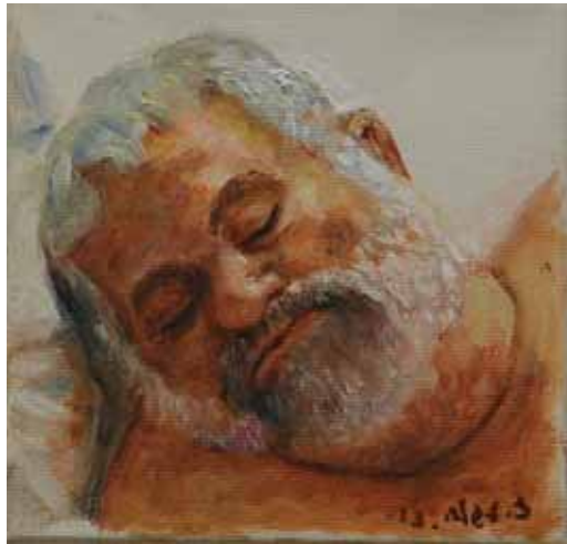
ציפי צגלה, מנשה ישן, 2013 שמן על בד, 15X15 ס"מ