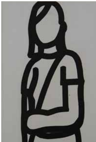
ערן שקין , דיוקן חיילת, 2012 טוש גרפיטי על בד, 30X20 ס"מ