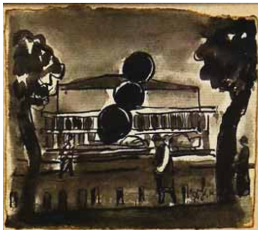
אהרון גלעדי, התרוממות, שנות ה-80 רישום וצבעי מים על נייר, 11.5X10 ס"מ