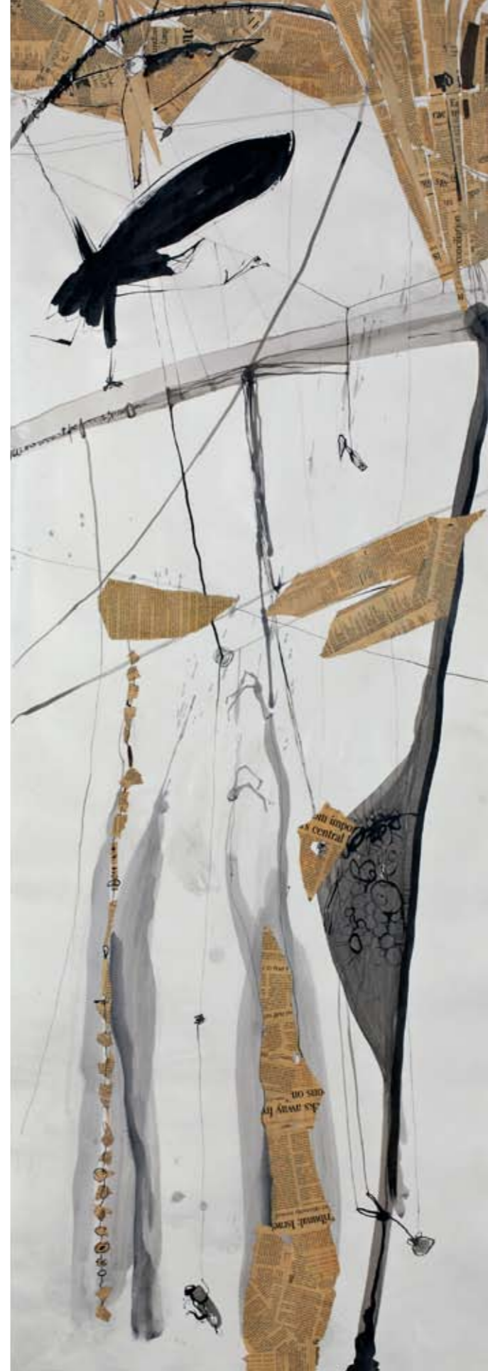
ללא שם / 2010 / קולאז' ודיו על נייר / 200 x 70 ס"מ Untitled / 2010 / Collage and ink on paper / 200 x 70 cm