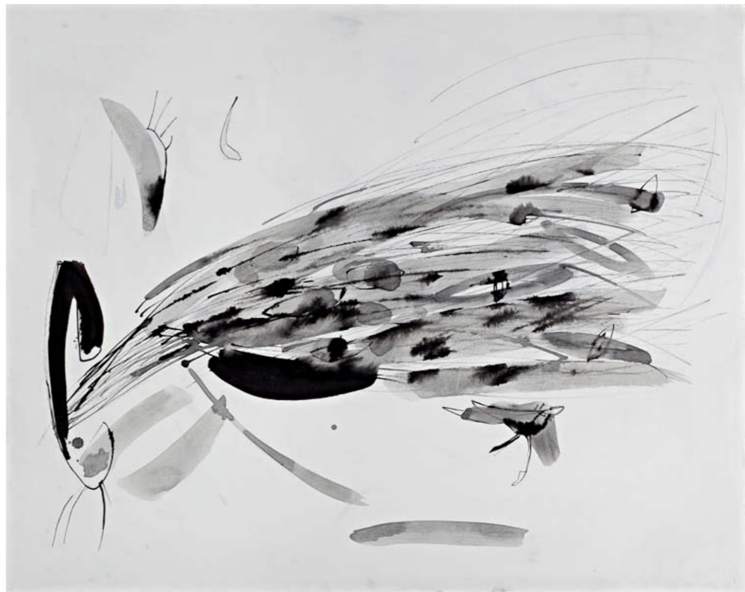
ללא שם / 2012 / דיו על בד / 80 x 100 ס"מ Untitled / 2012 / Ink on canvas / 80 x 100 cm