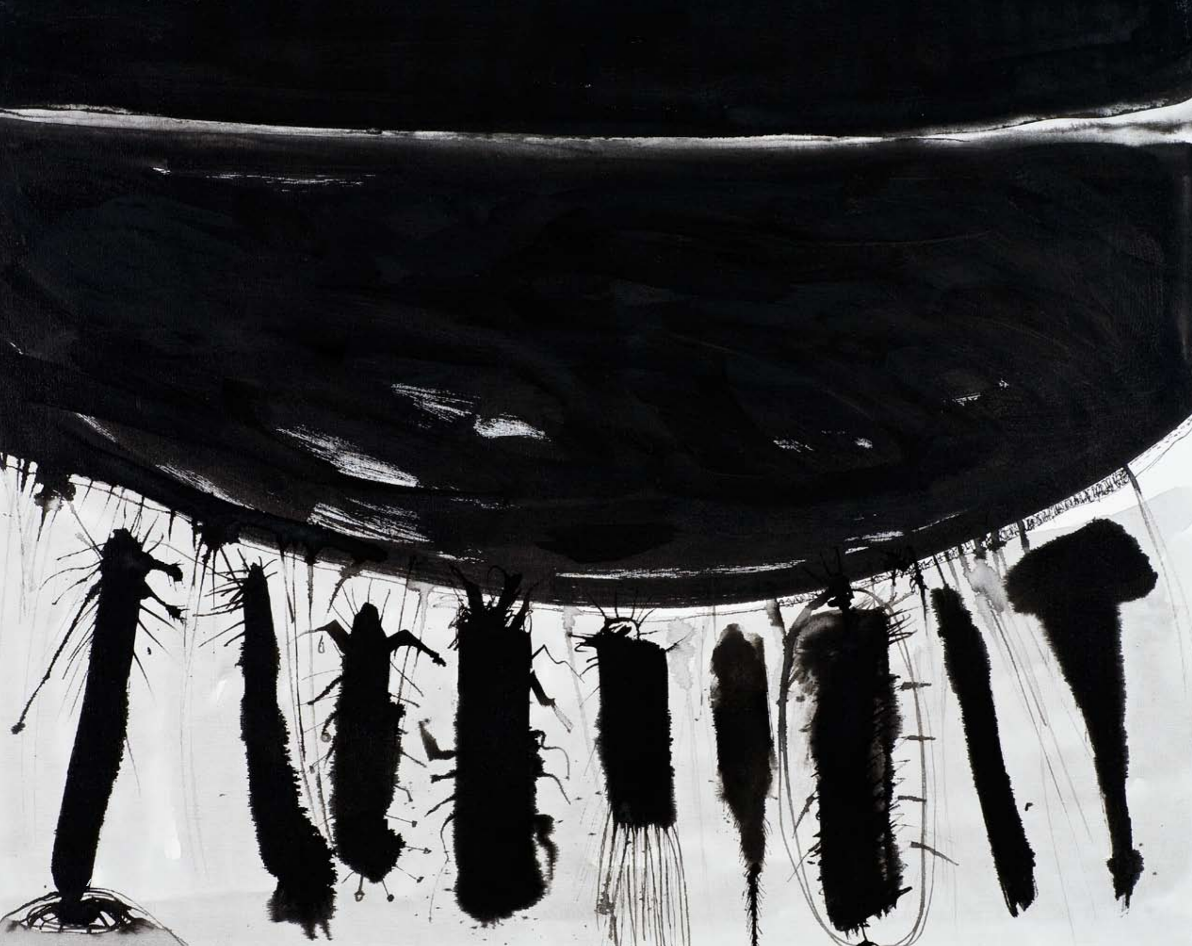
ללא שם / 2008 / דיו על בד / 80 x 100 ס"מ Untitled / 2008 / Ink on canvas / 80 x 100 cm