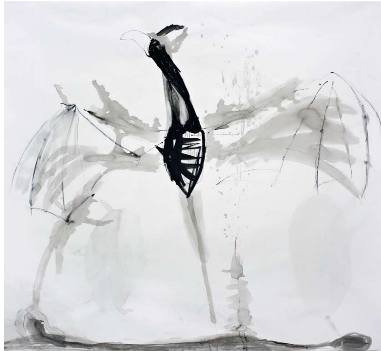
ללא שם / 2014 / דיו על בד / 200 x 210 ס"מ Untitled / 2014 / Ink on canvas / 200 x 210 cm