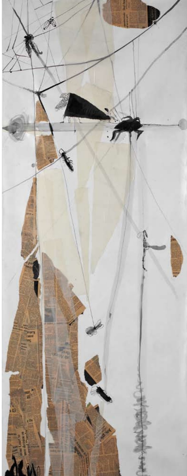
ללא שם / 2010 / קולאז' ודיו על נייר / 200 x 70 ס"מ Untitled / 2010 / Collage and ink on paper / 200 x 70 cm