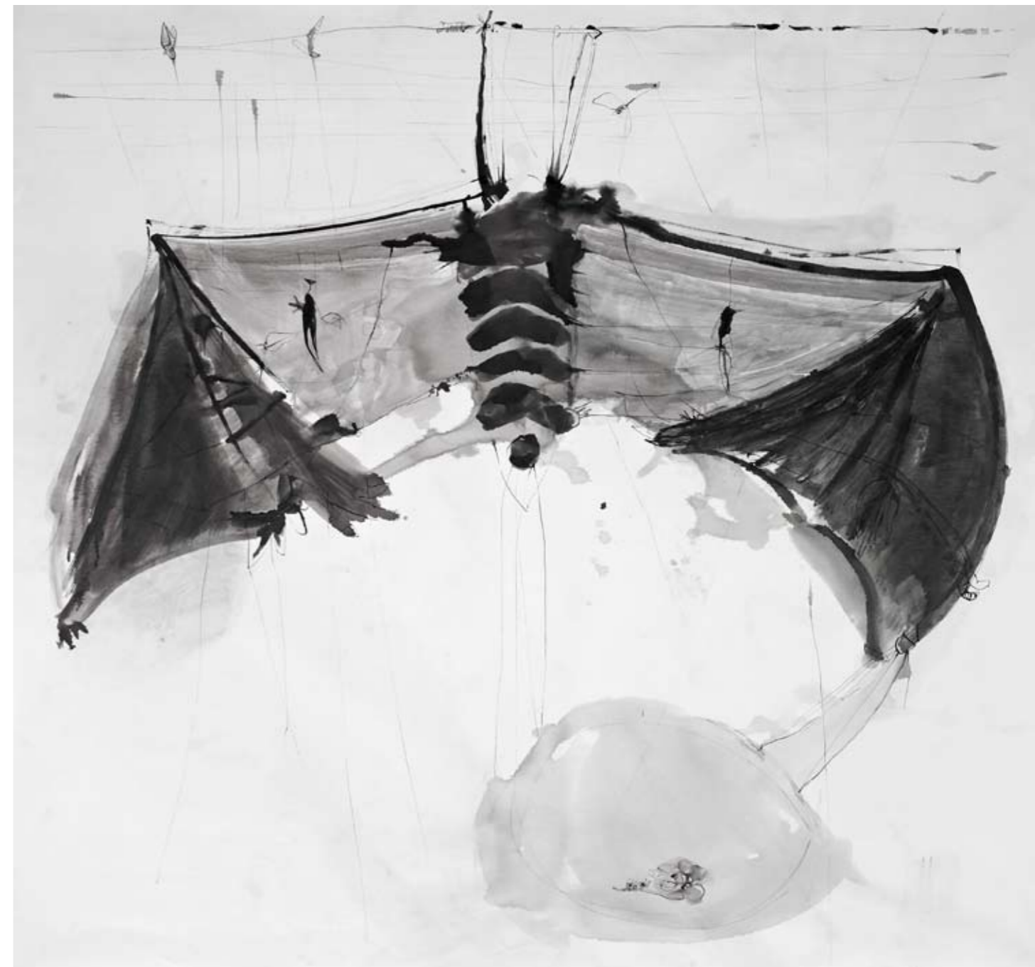
ללא שם / 2014 / דיו על בד / 200 x 210 ס"מ Untitled / 2014 / Ink on canvas / 200 x 210 cm