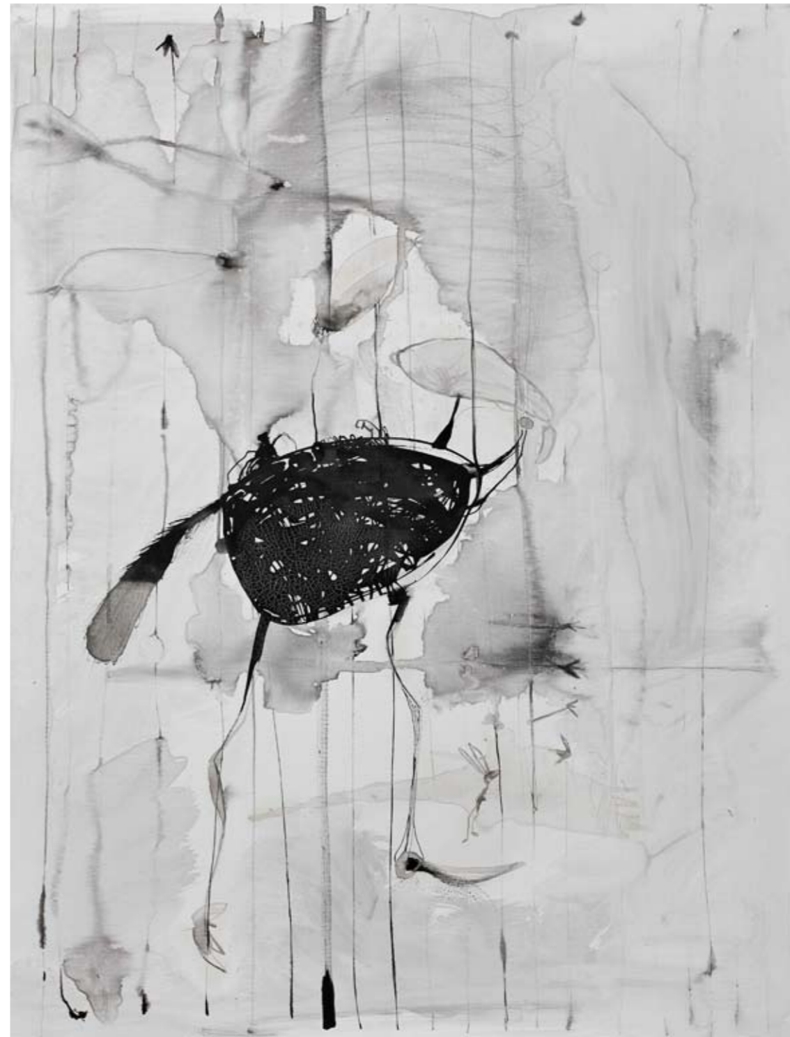
ללא שם / 2014 / דיו על בד / 120 x 90 ס"מ Untitled / 2014 / Ink on canvas / 120 x 90 cm