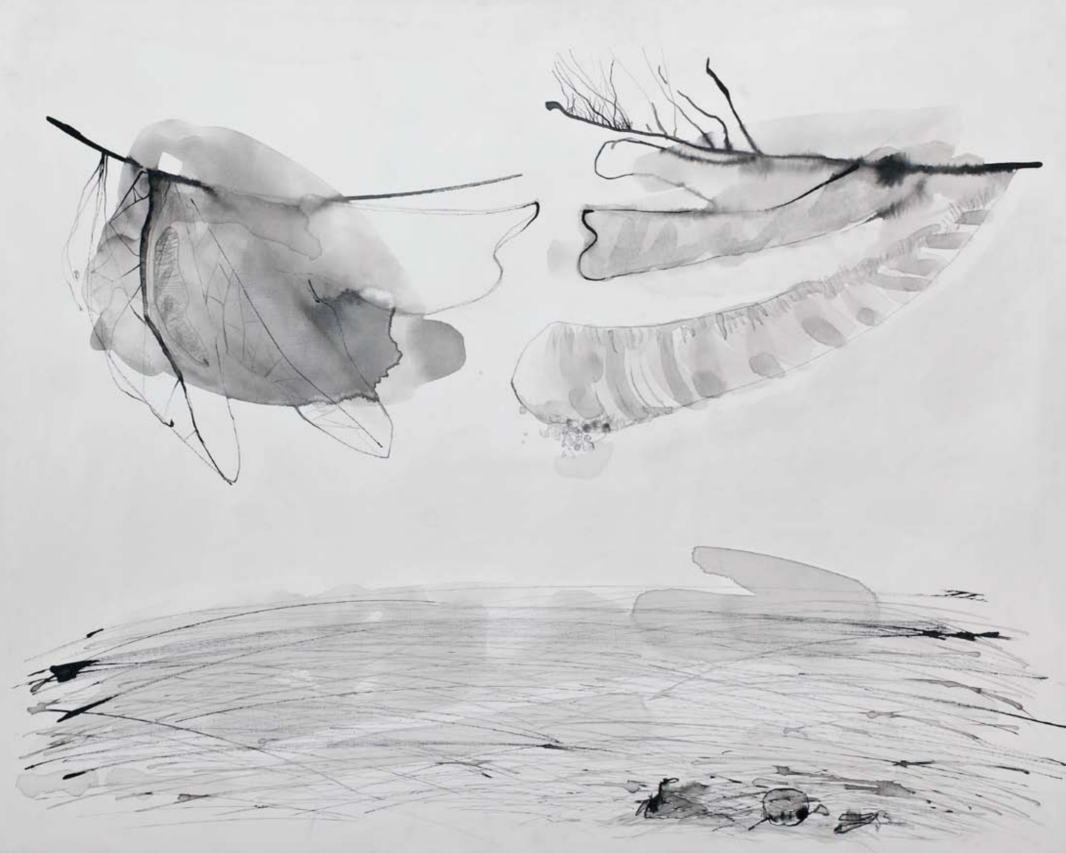
ללא שם / 2012 / דיו על בד / 80 x 100 ס"מ Untitled / 2012 / Ink on canvas / 80 x 100 cm