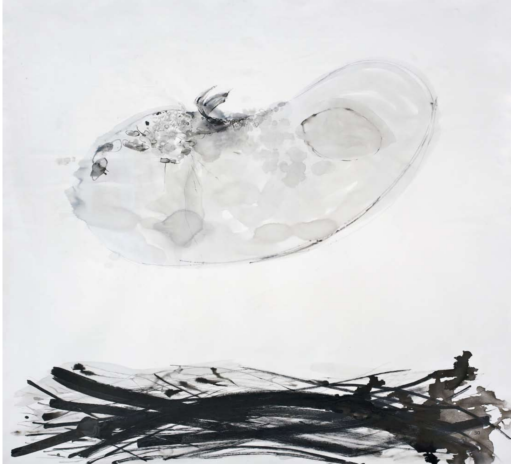
ללא שם / 2014 / דיו על בד / 200 x 210 ס"מ Untitled / 2014 / Ink on canvas / 200 x 210 cm