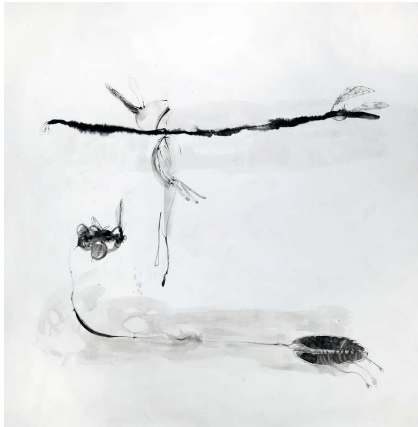
נלא שם / 2010 / דיו על בד / 200 x 200 ס"מ Untitled / 2010 / Ink on canvas / 200 x 200 cm