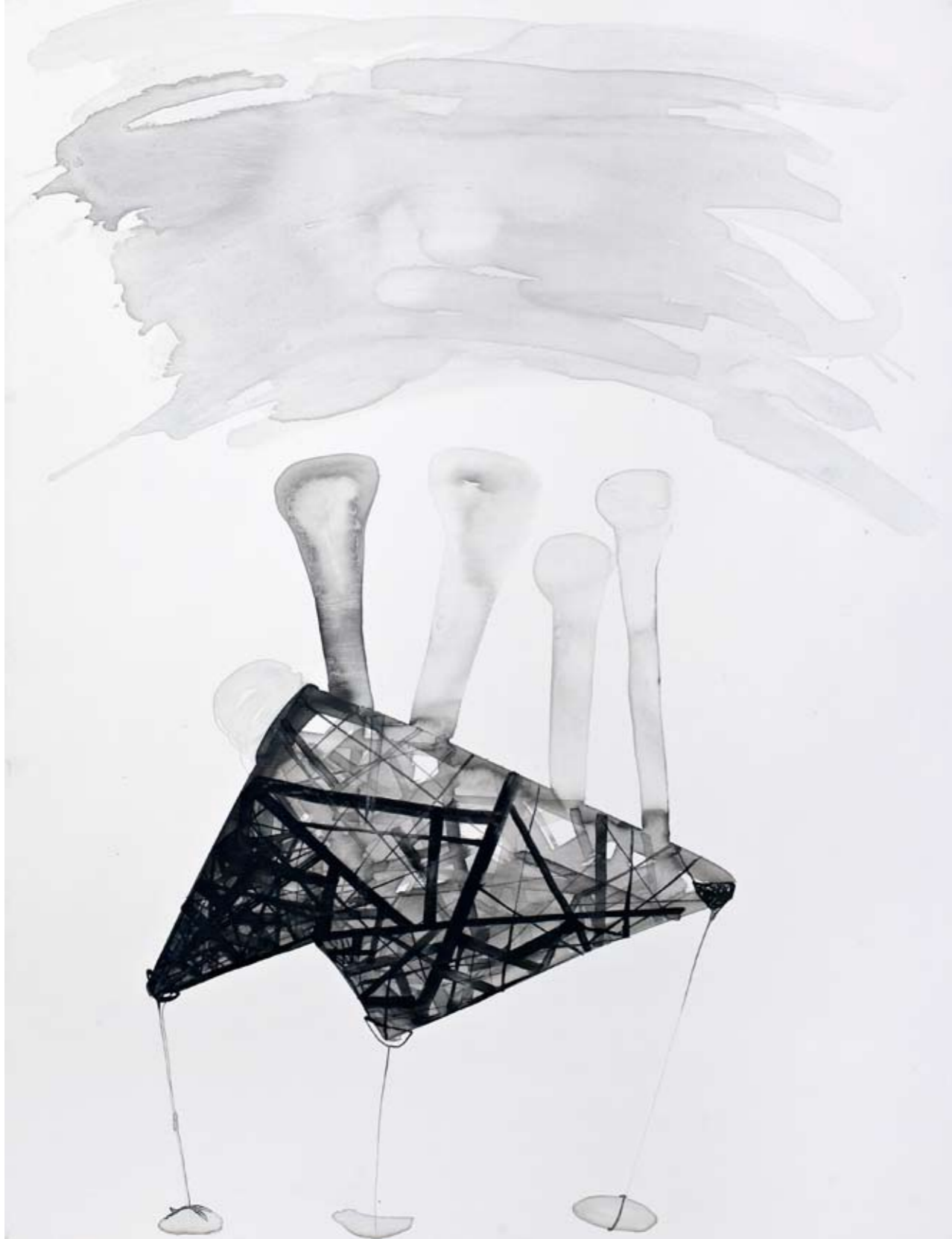
ללא שם / 2014 / דיו על בד / 120 x 90 ס"מ Untitled / 2014 / Ink on canvas / 120 x 90 cm