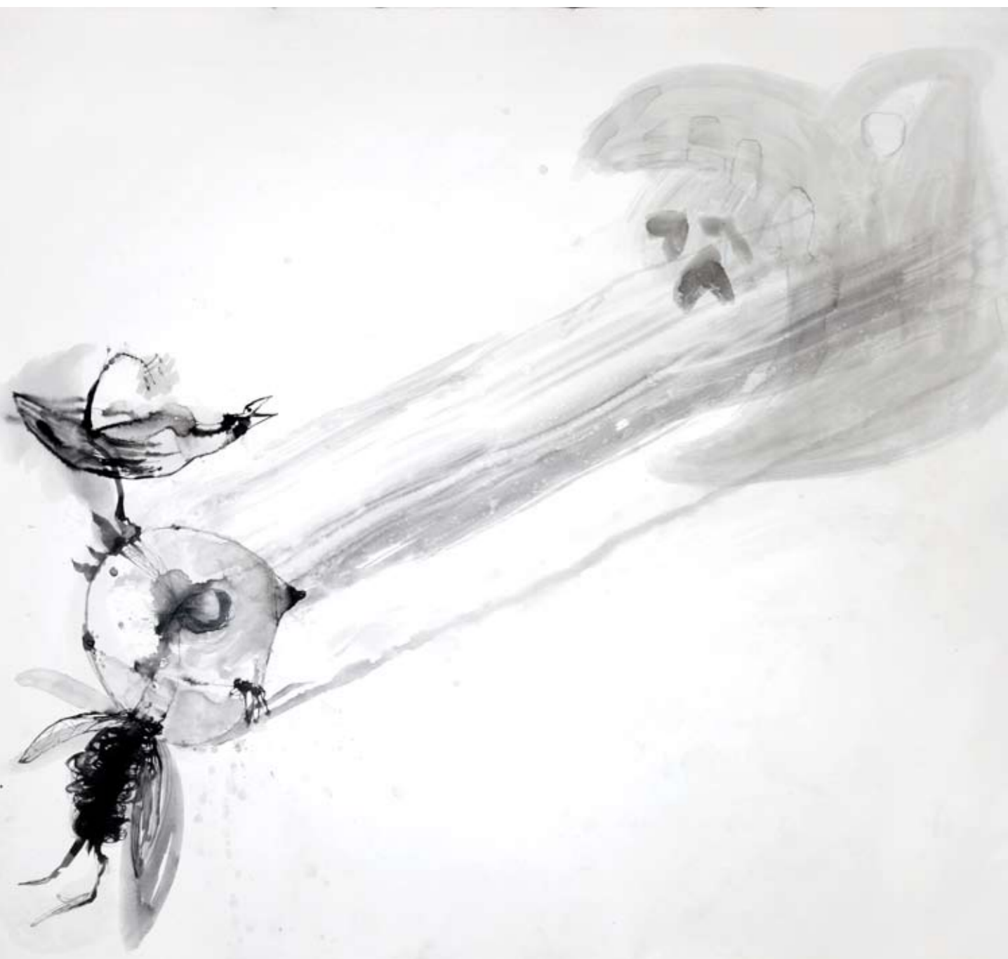
ללא שם / 2010 / דיו על בד / 200 x 210 ס"מ Untitled / 2010 / Ink on canvas / 200 x 210 cm