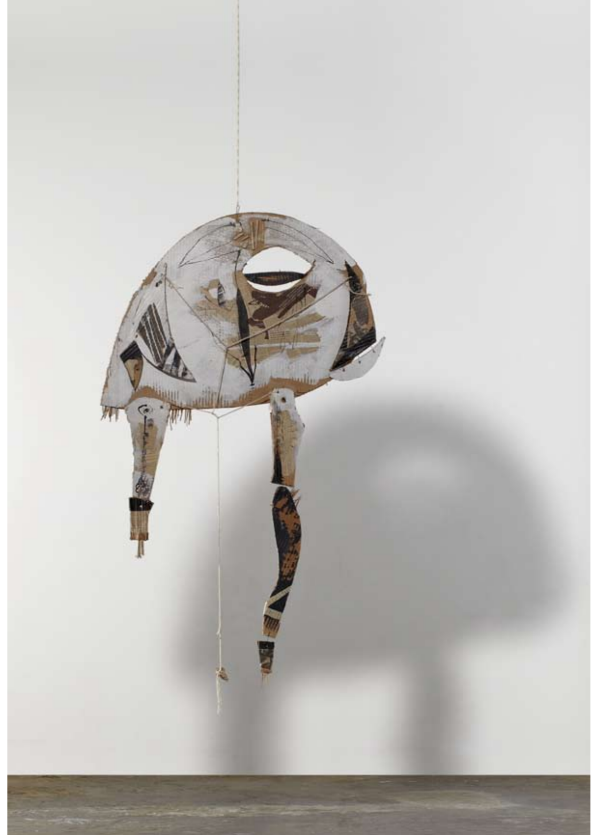
נלא שם / 2012 / מדיה מעורבת / גובה 120 ס"מ Untitled / 2012 / Mixed media / height 120 cm