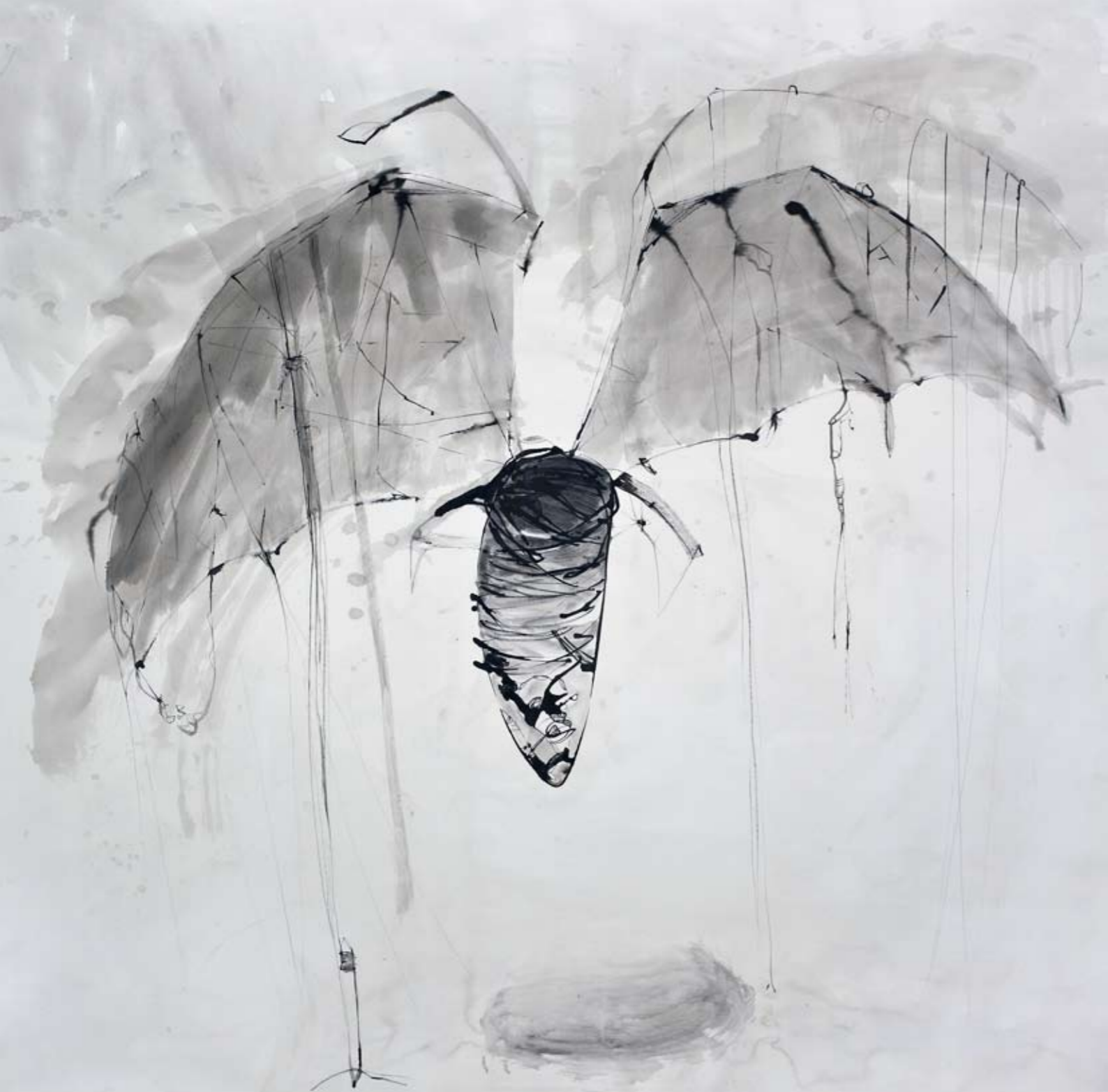
ללא שם / 2014 / דיו על בד / 210 x 200 ס"מ Untitled / 2014 / Ink on canvas / 210 x 200 cm