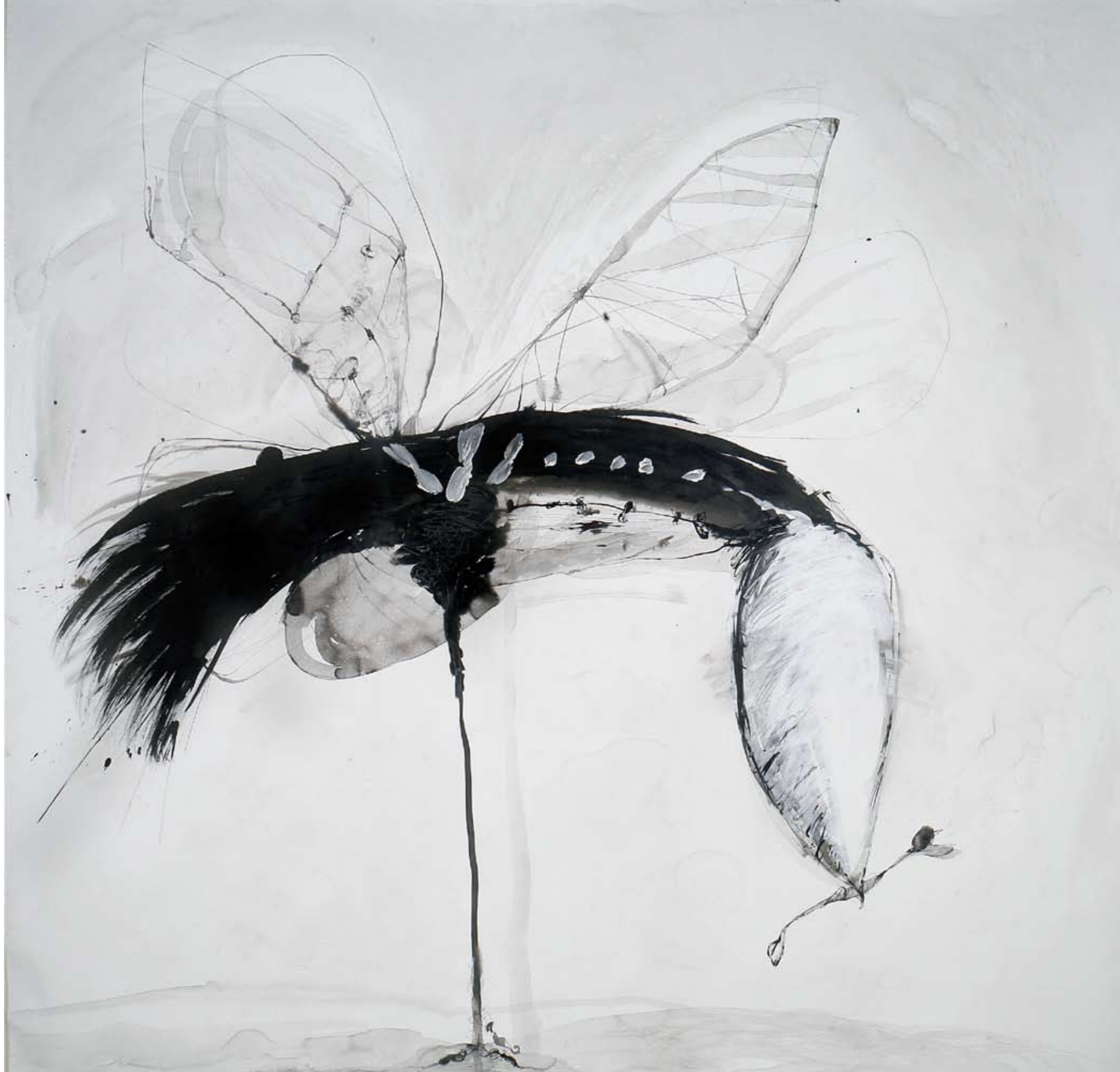
ללא שם / 2009 / דיו ואקריליק על בד / 200 x 210 ס"מ Untitled / 2009 / Ink and acrylic on canvas / 200 x 210 cm