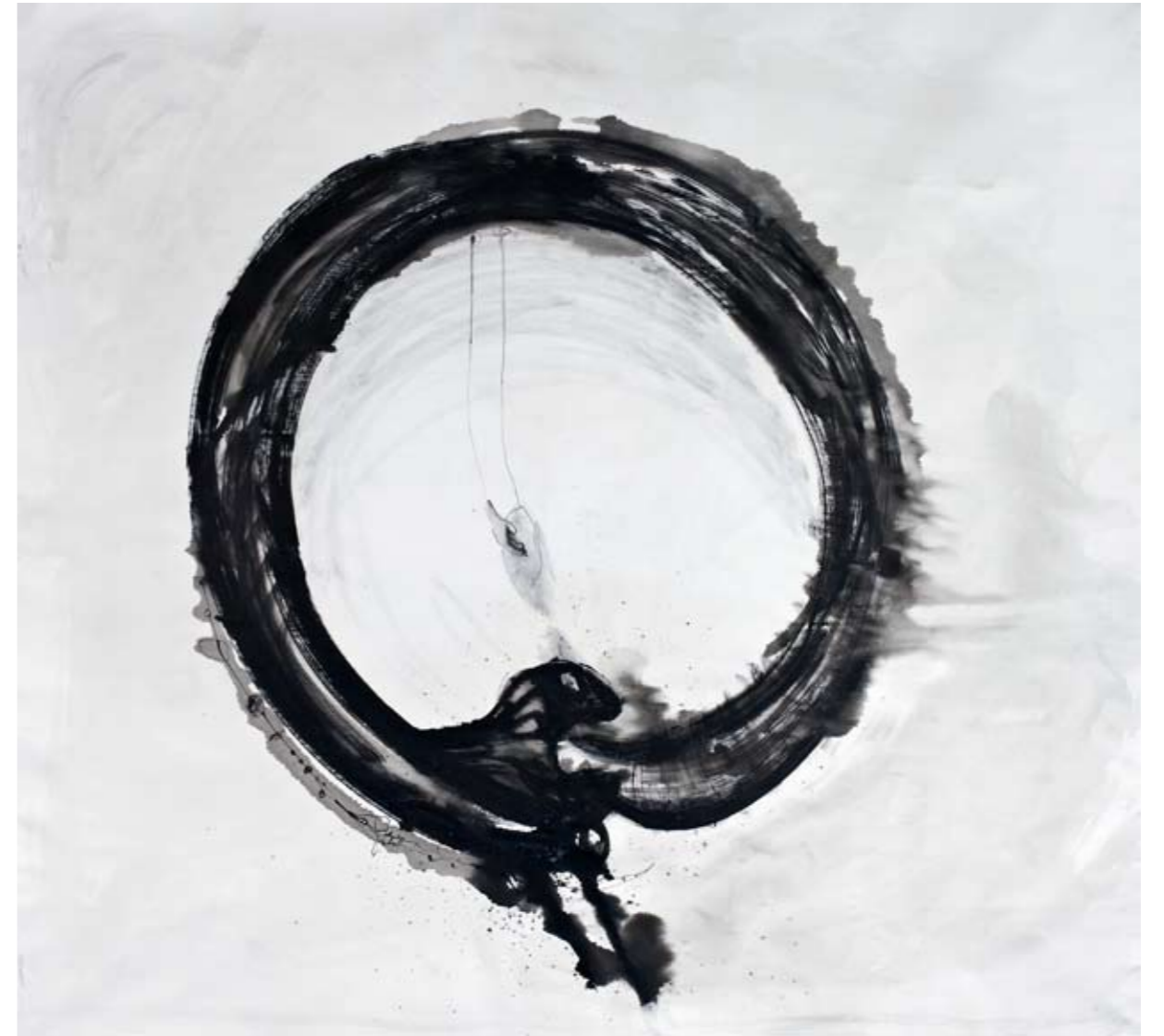
ללא שם / 2014 / דיו על בד / 210 x 200 ס"מ Untitled / 2014 / Ink on canvas / 200 x 210 cm