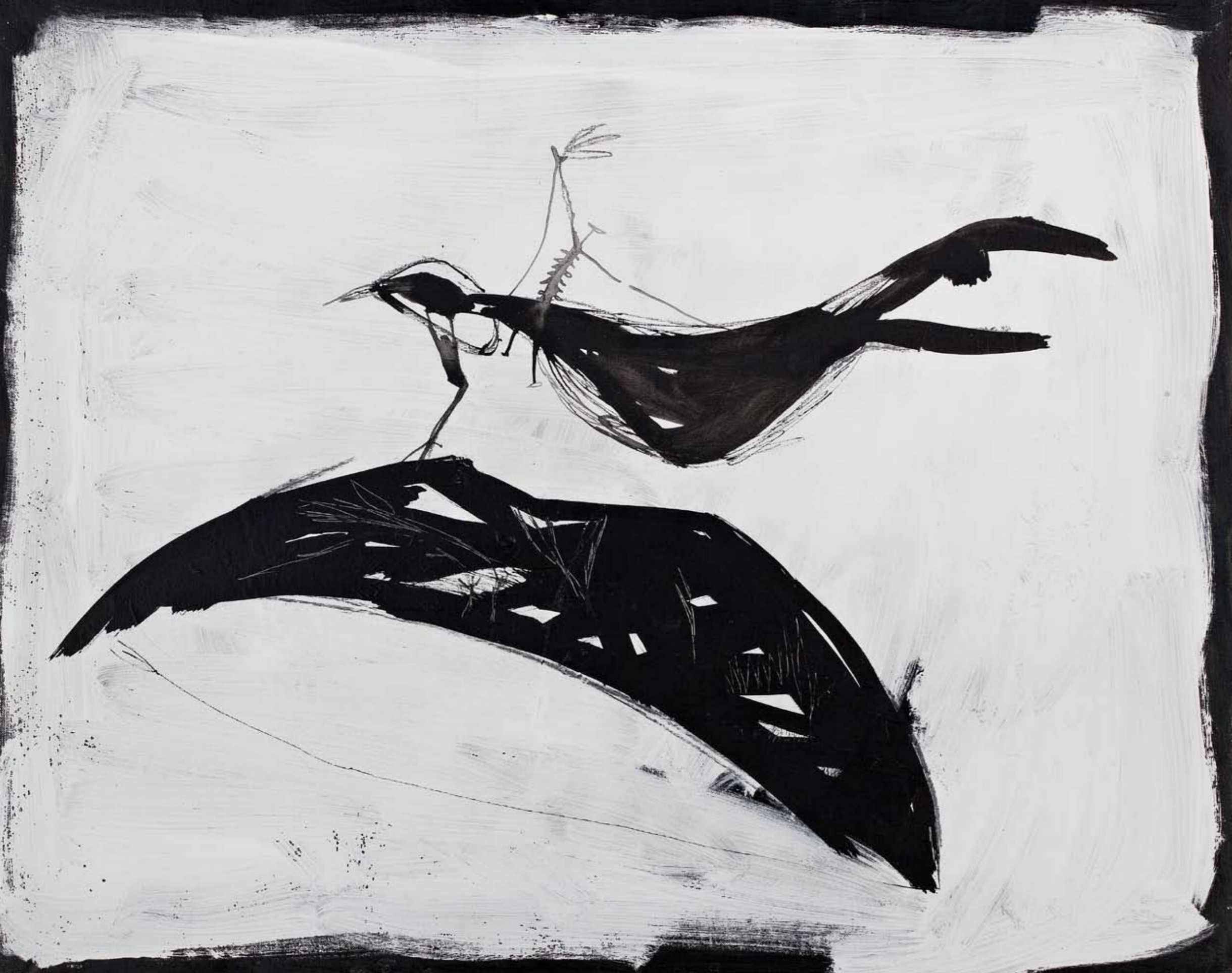
נלא שם / 2013 / דיו ואקריליק על בד / 80 x 100 ס"מ Untitled / 2013 / Ink and acrylic on canvas / 80 x 100 cm