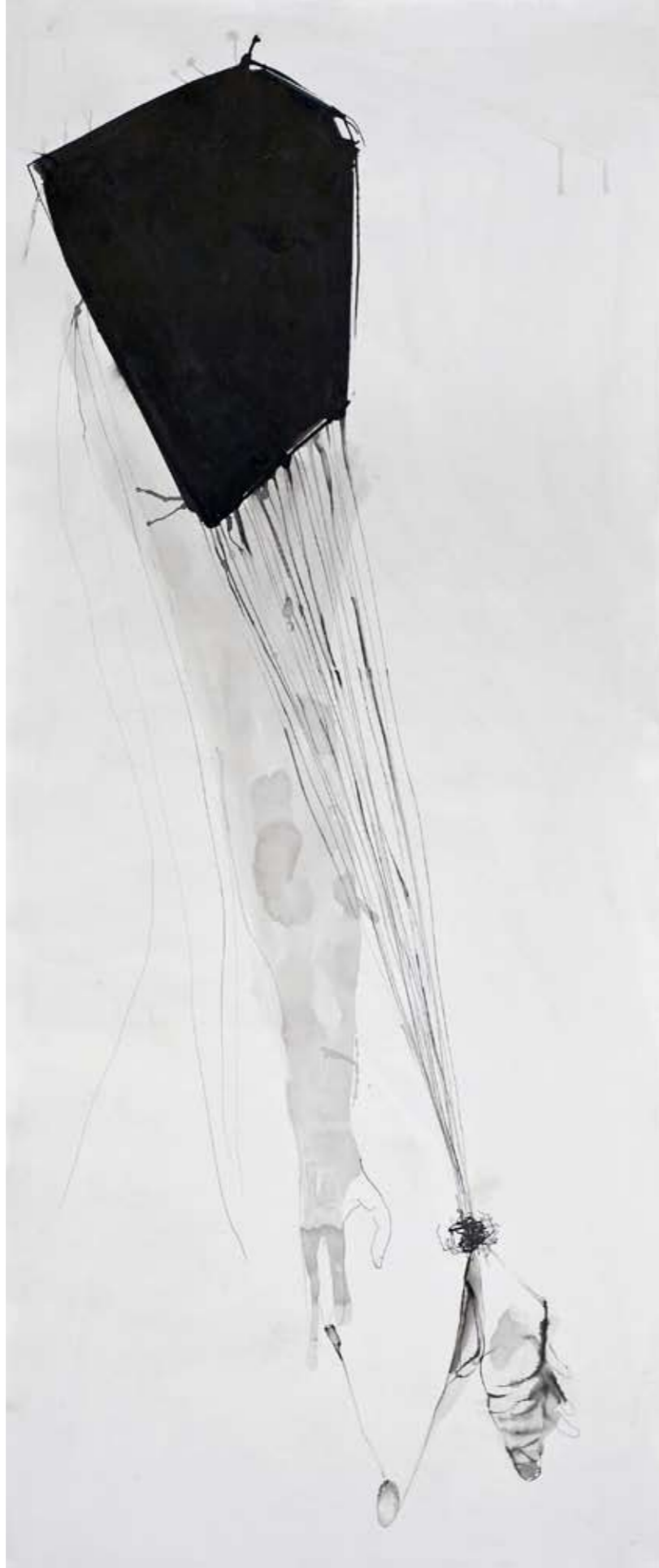
ללא שם / 2014 / דיו על בד / 100 x 200 ס"מ Untitled / 2014 / Ink on canvas / 200 x 100 cm