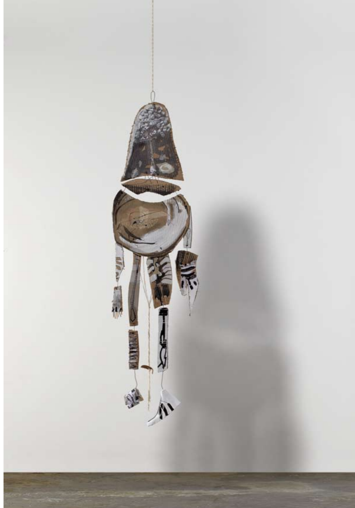
ללא שם / 2013 / מדיה מעורבת / גובה 145 ס"מ Untitled / 2013 / Mixed media / height 145 cm