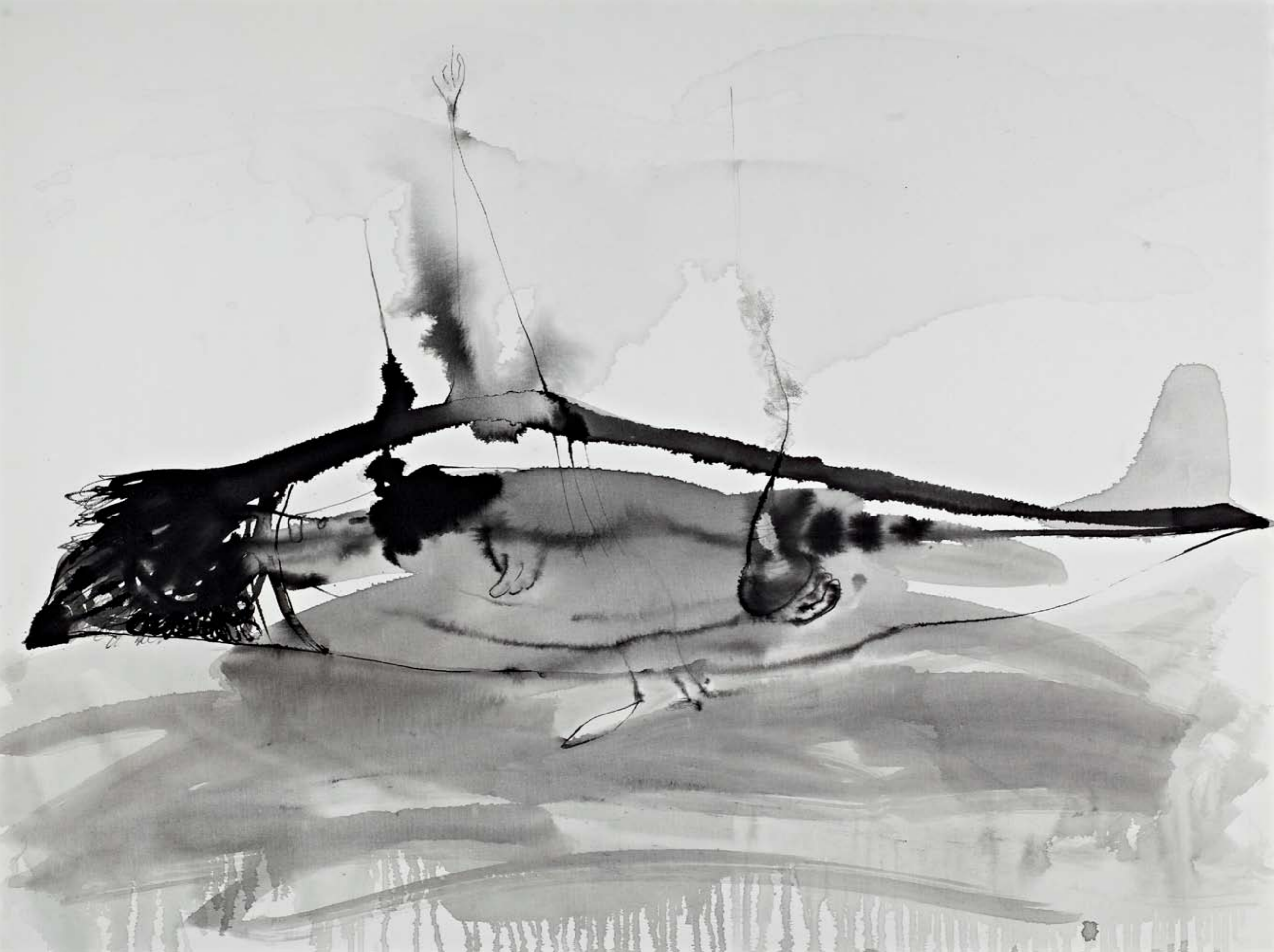
ללא שם / 2013 / דיו על בד / 90 x 120 ס"מ Untitled / 2013 / Ink on canvas / 90 x 120 cm