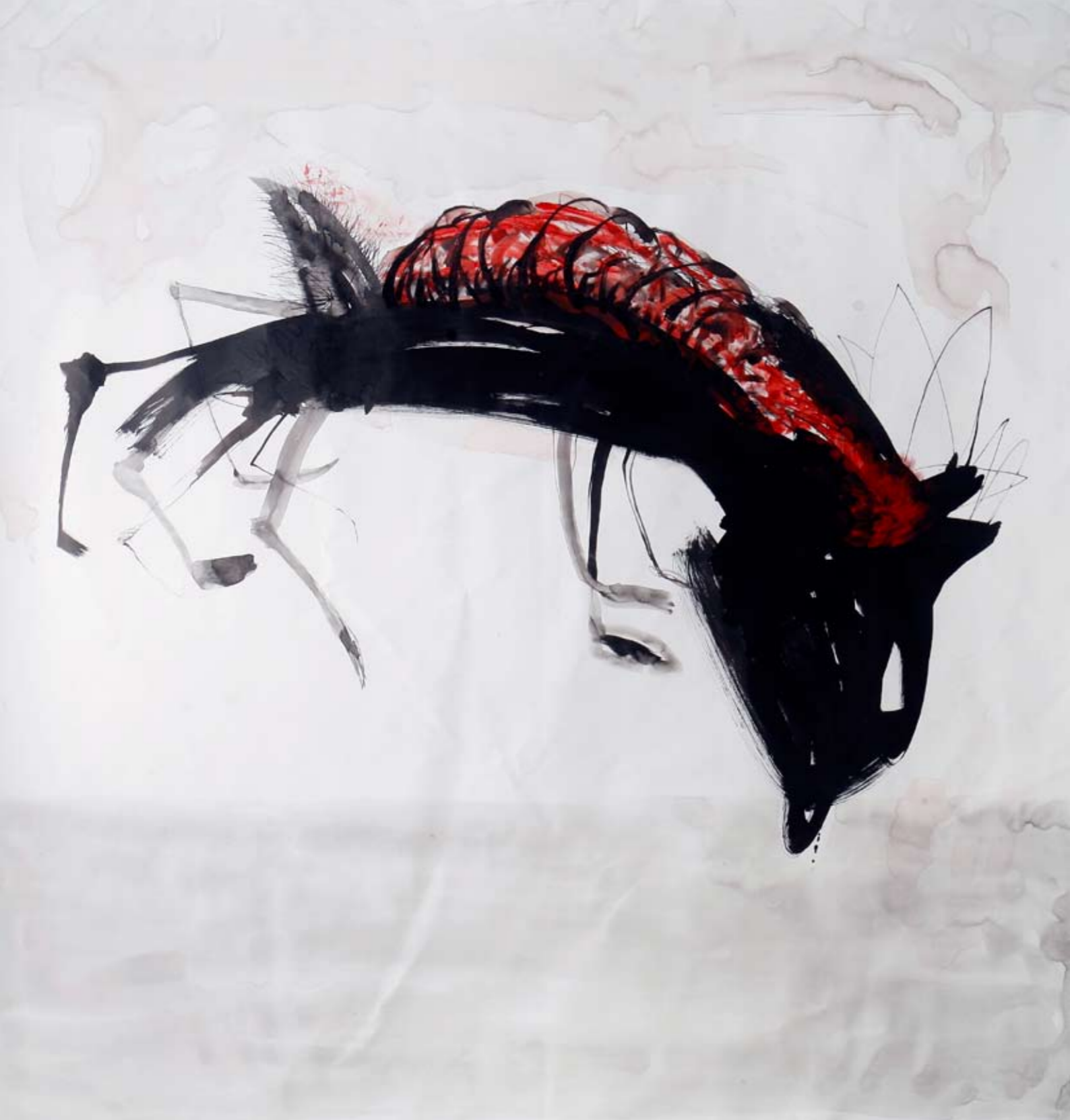
נלא שם / 2009 / דיו ואקריליק על בד / 210 x 200 ס"מ Untitled / 2009 / Ink and acrylic on canvas / 210 x 200 cm