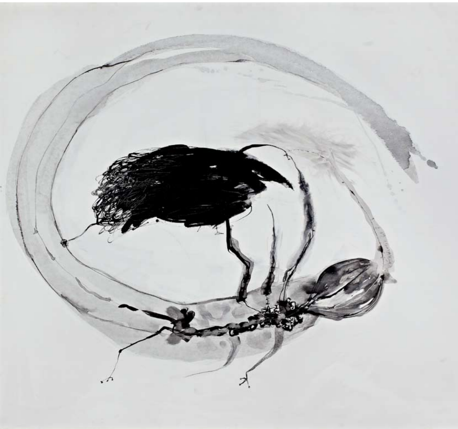
ללא שם / 2011 / דיו על בד / 100 x 120 ס"מ Untitled / 2011 / Ink on canvas / 100 x 120 cm